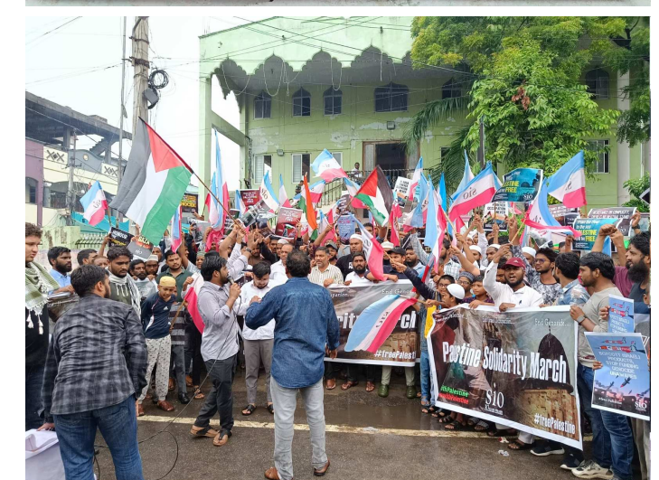
తదితరులు పాల్గొన్నారు. ఎస్ఐబివో సభ్యులు ఫిలస్టీనాకు సంఘీభావంగా ఘోషారాలు ప్రదర్శించారు.