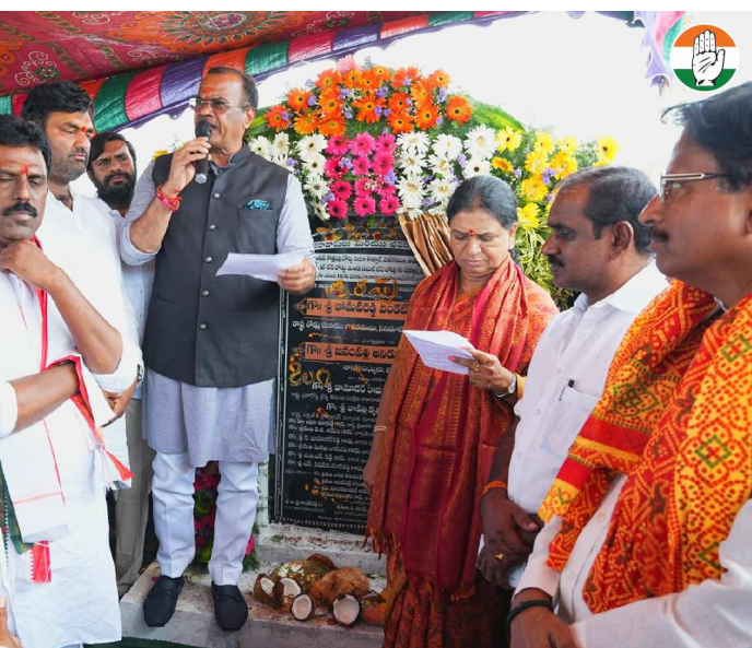
Komatireddy Venkat Reddy Minister of Roads & Buildings and Cinematography

మహబూబ్ నగర్, జూలై 15 తెలంగాణ ముచ్చట్లు: బీఆర్ఎస్ పార్టీ నిరుద్యోగులతో రాజకీయాలు చేయాలని చూస్తుందని మంత్రి కోమటిరెడ్డి వెంకట్ రెడ్డి మండిపడ్డారు. తాము మంచి చేయాలని చూస్తుంటే అడ్డుకుంటున్నారని అన్నారు. పదేళ్ల కాలంలో కేసీఆర్ నిరుద్యోగుల గురించి ఎప్పుడు మాట్లాడలేదని ఇప్పుడు డిఎస్సీ ద్వారా నిరుద్యోగులకు మంచి చేయాలని చూస్తుంటే తప్పుదారి పట్టిస్తున్నారని విమర్శించారు. పాలమూరు, కొడంగల్ ప్రాజెక్టుపై ప్రత్యేక రృష్టి పెట్టి త్వరలోనే వాటిని పూర్తి చేస్తామన్నారు. బీఆర్ఎస్