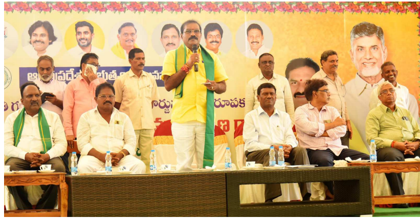
విజయవాడ తెలంగాణ ముచ్చట్లు : గత ప్రభుత్వం ఐదేళ్ల హయాంలో

పోలవరం ప్రాజెక్టు విధ్వంసానికి గురైందని, వారి నిర్లక్ష్యంతోనే దయాప్రం వాల్ కొట్టుకుపోయిందని రాష్ట్ర జలవనరులశాఖ మంత్రివర్గులు డా. శ్రీ నిమ్మల రామానాయుడు అన్నారు. సోమవారం విజయవాడలోని కె.ఎల్.రావు ఫూట్ లో రాష్ట్ర జలవనరులశాఖ ఆధ్వర్యంలో నిర్వహించిన 'పద్దభూషణ్' డా. కానూరి లక్ష్మణరావు 122వ జయంతి వేడుకలకు మంత్రి ముఖ్యఅతిథిగా హాజరయ్యారు. డా.కె.ఎల్.రావు చిత్రపటానికి, విగ్రహానికి పూలమాలలు వేసి ఘన నివాళి అర్పించారు. ఈ సందర్భంగా మంత్రి రామానాయుడు మాట్లాడుతూ.. 50 ఏళ్ల క్రితమే నదుల అనుసంధానాన్ని ప్రతిపాదించిన దార్మనికుడు, తెలుగుజాతి గర్వించదగిన ఇంజనీరు, 'పద్దభూషణ్' డా. కానూరి లక్ష్మణరావు అని, ఆయన జయంతి వేడుకలు నిర్వహించడం శుభ పరిణామం అన్నారు. నీటి పారుదల రంగానికి విశేష సేవలు అందించి, భావితరాలకు స్ఫూర్తిగా నిలిచిన సర్ ఆర్థర్ కాటన్, మోక్షగుండం విశ్వేశ్వరయ్య, డా.కె.ఎల్.రావు, శ్రీరామకృష్ణయ్య వంటి మహనీయుల జయంతి వేడుకలను 2014-2019 ప్రభుత్వ పాలనలో ఎంతో ఘనంగా నిర్వహించామని తెలిపారు. అయితే, గత ప్రభుత్వ పాలనలో సాగు, తాగునీటి రంగాలకు విశేష సేవలు అందించిన మహనీయుల జయంతి కార్యక్రమాలను నిర్వహించకపోవడం బాధాకరమన్నారు. నాగార్జున సాగర్ రాజశిల్పి, కృష్ణా డెల్టాను సస్యశ్యామలం చేసిన కె.ఎల్.రావు విగ్రహానికి కనీసం రంగు వేసిన పాపాన కూడా పోలేదన్నారు. గత ఐదేళ్ల పాలనలో వారు చూపిన నిర్లక్ష్యంతోనే పోలవరం ప్రాజెక్టు దయాప్రం వాల్ కొట్టుకుపోయిందన్నారు. అయితే కొత్త ప్రభుత్వం ఏర్పడిన వెంటనే సాగు, తాగునీటి ప్రాజెక్టులపై ప్రత్యేక శ్రద్ధ పెట్టినట్లున్నారు. గౌరవ సీఎం చంద్రబాబు తొలి పర్యటనగా పోలవరం వెళ్లారని, ప్రతి సోమవారం పోలవరంపై సమీక్షలు నిర్వహిస్తున్నారని ఇది ఆయన చిత్తశుద్ధికి నిదర్శనమన్నారు.