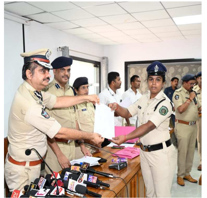
ఐపిఎస్.కి తమ హృదయ పూర్వక ధన్యవాదాలు తెలియ జేశారు.