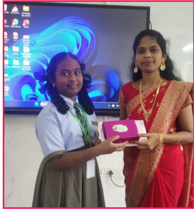
మాంట్ ఫోర్డ్ స్కూల్ లో టీచర్ లు ధియాకి బహుమతి ఇస్తున్న స్టూడెంట్

జరుపుకున్నారు. “ఉపాధ్యాయులే మన జీవితానికి బాటలు వేసే వ్యక్తులు,” అని ఓ విద్యార్థి చెప్పాడు. “వారు బోధించే పాఠాలు కేవలం పుస్తకాల వరకే కాకుండా, జీవితం ఎలా జీవించాలో కూడా నేర్పుతాయి.” అని అన్నారు. పలు విద్యాలయాలలో సాంస్కృతిక కార్యక్రమాలు నిర్వహించబడ్డాయి. విద్యార్థులు తమ గాత్రం, నాట్య ప్రదర్శనలతో ఉపాధ్యాయులను గౌరవిస్తూ, వారిపై వారి ప్రేమను వ్యక్తం చేశారు. “గురువులు లేకుండా విద్యార్థులు విజయాన్ని పొందలేరు,” అని సాంస్కృతిక కార్యక్రమంలో పాల్గొన్న ఒక విద్యార్థి వ్యాఖ్యానించాడు. “ఉపాధ్యాయులు విద్యార్థుల్లోని ప్రతిభను వెలికితీసే దీపస్వంభాలు,” అని ఓ పాఠశాల ప్రిన్సిపాల్ అభిప్రాయపడ్డారు. “వారి కృషి లేకుండా సమాజానికి ఉన్నత విద్యావంతులను అందించడం అసాధ్యం.” “ఉపాధ్యాయులు విద్యకు వన్నె తెచ్చేవారు. వారు మార్గనిర్దేశకులు మాత్రమే కాదు, మార్గం చూపే వ్యక్తులు” అని “వారు చూపిన మార్గంలోనే సమాజం ఎదుగుతుంది, అభివృద్ధి చెందుతుంది.” విద్యార్థులు తమ టీచర్లకు కృతజ్ఞతలు తెలుపుతూ, వారిచ్చిన మార్గదర్శకత్వంతో ఉన్నత శిఖరాలను అధిరోపించడమే తమ లక్ష్యం అని ప్రకటించారు. “గురువులు విద్యార్థుల విజయానికి వెన్నుదన్నుగా నిలిచే శక్తులు,” అని పలువురు కొనియాడారు.