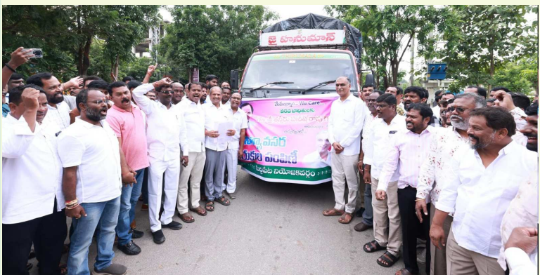
సిద్దిపేట, తెలంగాణ ముచ్చట్లు : ఖమ్మం, మహబూబాబాద్ జిల్లాల్లో భారీ వర్షానికి తీవ్ర నష్టం వాటిల్లినది, వరద బాధితులకు సిద్దిపేట నుంచి ఉడత

భక్తిగా సహాయం చేస్తున్నామని బిఆర్ఎస్ ఎంఎల్ఎ హరీష్ రావు తెలిపారు. మానవ సేవయే మాధవ సేవ అని అందరూ ముందుకు వచ్చి వరద బాధితులకు సహాయం చేయాలని పిలుపునిచ్చారు. సిద్దిపేటలోని క్యాంపు కార్యాలయం వద్ద ఖమ్మం వరద బాధితులకు సరకులు పంపే వాహనాలకు మాజీ మంత్రి ఎమ్మెల్యే హరీష్ రావు జెండా ఊపి ప్రారంభించారు. ఈ సందర్భంగా హరీష్ రావు మాట్లాడారు. సహాయం చేయడంలో కాంగ్రెస్