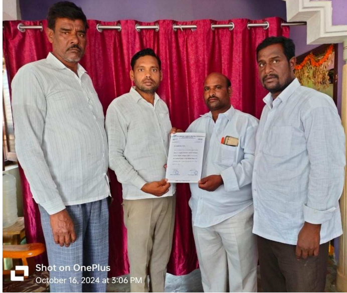
దుబ్బాక, తెలంగాణ ముచ్చట్లు