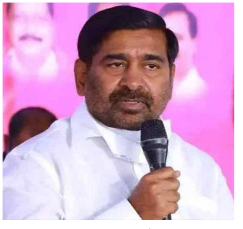
యాదాద్రి భువనగిరి, (అక్టోబర్ 23) : రామ స్వపేటల నిర్మించ తల పెట్టిన అంబుజా సిమెంట్