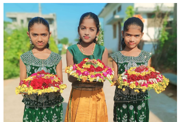
హన్మకొండ జిల్లా కరుణాపురంలో.. బతుకమ్మను తీసుకెళ్తున్న చిన్నారులు