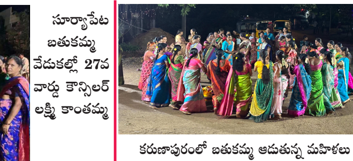
కరుణాపురంలో బతుకమ్మ ఆడుతున్న మహిళలు