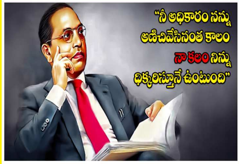
"సీ అధికారం నన్ను ఆడివివేసినంత కాలం నా కంటిని నన్ను ధిక్కరిస్తున్నానంటుంది"