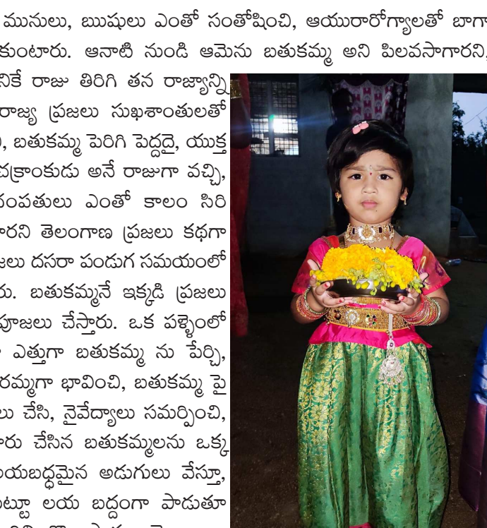
హన్మకొండ జిల్లా తాటికాయల గ్రామంలో బతుకమ్మతో చిన్నారు సనుబాల వాయిక