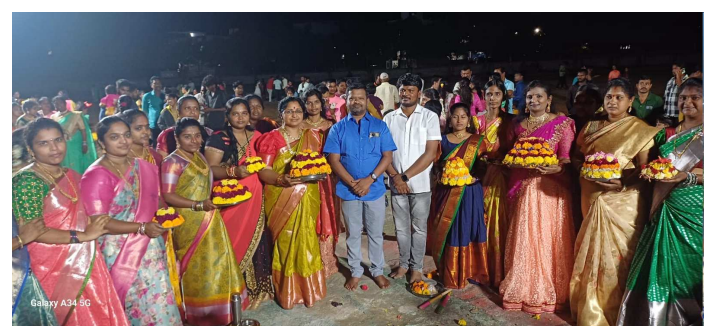
జనగామ పట్టణంలో జరిగిన బతుకమ్మ వేడుకల్లో పాల్గొన్న పలువురు కౌన్సిలర్లు