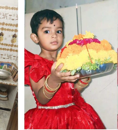
జనగాం జిల్లా స్టేషన్ ఘనపూర్ లో బతుకమ్మతో చిన్నారు యుక్త