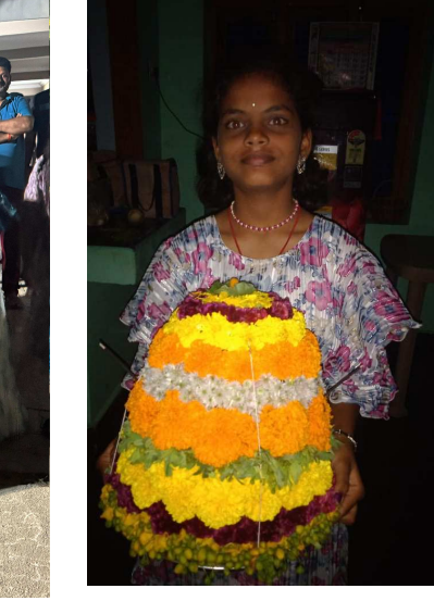
జనగాం జిల్లా పెంబర్తిలో బతుకమ్మతో చిన్నారు