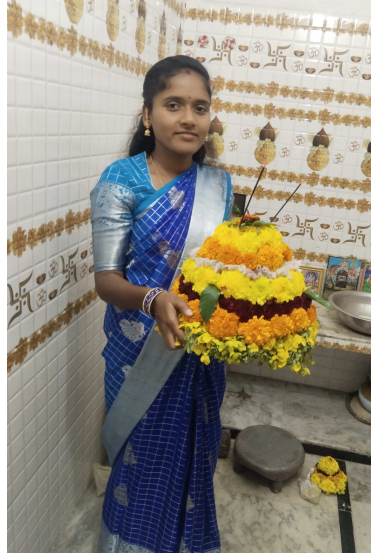
తరిగొప్పులలో... బతుకమ్మను తీసుకెళ్తున్న మహిళ