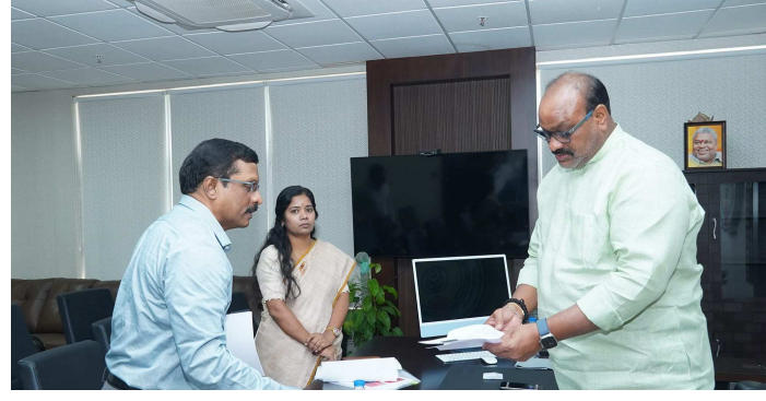
గుంటూరు, అక్టోబర్ 7 తెలంగాణ ముచ్చట్లు : గుంటూరు కలెక్టరేట్లో వ్యవసాయ శాఖ మంత్రి అచ్చెన్నాయుడు సమాక్ష నిర్వహించారు. కౌలురైతుల చట్టంపై 5 జిల్లాల వ్యవసాయ శాఖ అధికారులతో చర్చించారు. 1956లోనే కౌలురైతుల చట్టాన్ని తీసుకొచ్చారని, అయితే, 2011లో చట్టంలో చేసిన

మార్పుల కారణంగా సమస్యలు వచ్చాయిన్నారు. గత బడ్జెట్లో కౌలురైతులు అనేక ఇబ్బందులు పడ్డారు. రైతులు, కౌలుదారులతో చర్చించి నిర్ణయం తీసుకోవాలని సీఎం చంద్రబాబు చెప్పారు. ప్రాంతీయ సదస్సుల ద్వారా అభిప్రాయాలు తీసుకొని చట్టం రూపకల్పన చేశాం. తొలి ప్రాంతీయ సదస్సు గుంటూరులో నిర్వహించాం. అందరికీ ఆమోదయోగ్యమైన కౌలు చట్టం అమలుకు ప్రభుత్వం సిద్ధంగా ఉంది' అని అచ్చెన్నాయుడు పేర్కొన్నారు.