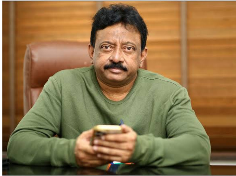
సీఎం జేఎల్ మీడియాలో పోస్టులు చేశారు. అలాగే, చంద్రబాబు నాయుడు, పవన్ కల్యాణ్, నారా లోకేశ్ వంటి నేతల ఫోటోలను మార్చి చేసి ప్రచారం చేశారు

ఏపీ పోలీసుల గాలింపుపై డైరెక్టర్ RGV స్పందించారు. ఈ కేసులకు నేనే భయపడడం లేదు అంటూ ఓ వీడియో రిలీజ్ చేశారు ఆర్డీవీ. మద్దిపాడు పోలీస్ స్టేషన్ పరిధిలో వర్తమా అభ్యుత్తరకర పోస్టుల కేసు నమోదైంది. టీడీపీ కార్యకర్తలు ఇప్పటి వరకు పిర్యాదులు నమోదయ్యాయి. రామ్ గోపాల్ వర్మ తన సినిమా పూజాం ప్రకారం సమయంలో వైసీపీ ప్రభుత్వాన్ని తక్కువచే