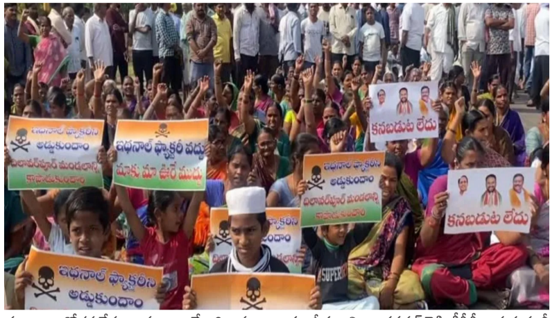
ప్రజలు ఆందోళన చేస్తున్నారు. అయితే అధికారులు ఎవ్వరూ పట్టించుకోవడం లేదంటూ వారు ఆగ్రహం వ్యక్తం చేశారు. దీంతో బీజేపీ నేత మహేశ్వర్ రెడ్డి,

నిర్మల్ జిల్లా దిలావర్పూర్లో హైటెన్షన్ వారణం చేటుచేసుకుంది. ఆర్డీవో రక్షకల్యాణిని దిలావర్పూర్ గ్రామస్థులు కారులోనే దాదాపు 5 గంటలుగా నిర్బంధించారు. ఇందులో భాగంగా మండల కేంద్రంలో నిర్వహించిన ఇబనాల్ ఫాక్టరీ రద్దు చేయాలని దిలావర్పూర్ గ్రామస్థులు తమ పోరాటం ఉధృతం చేశారు. ఈ మేరకు గ్రామస్థులు హైవేపై మెరుపు దర్శక దిగారు. సుమారు 11 గంటలుగా నిరసన వ్యక్తం చేస్తున్నారు. గ్రామంలో ని ఇళ్లకి, స్కూళ్లకు తాకాలు వేసి మరి రాస్తారోకో రోడ్లకూర్చారు. చిన్నా, పెద్దా అంతా కలిసి ర్యాలీగా రోడ్లకూర్చారు. గ్రామస్థుల మెరుపు ధర్మాతో రోడ్డుపై భారీగా ట్రాఫిక్ జామ్ ఏర్పడింది. దీంతో దిలావర్పూర్లో 500 మంది పోలీసులు భారీగా మోహరించారు. గత కొన్ని రోజులుగా ఇబనాల్ ఫాక్టరీకి వ్యతిరేకంగా దిలావర్పూర్, గుండం వల్లి గ్రామ