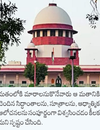
మతంలోకి మారాలనుకొనేవారు ఆ మతానికి చెందిన నిర్ణయాలు, సూత్రాలను, ఆధ్యాత్మిక ఆలోచనలను సంపూర్ణంగా విశ్వసించడం కీలకమని స్పష్టం చేసింది.

వేరే మత విశ్వాసాలను అనుసరిస్తూ, కేవలం రిజర్వేషన్ ప్రయోజనాలను పొందడానికి తమను తాము హిందువులుగా పేర్కొనడాన్ని సుస్థిం కొద్దు తీవ్రంగా తప్పుబట్టింది. ఇది రాజ్యాన్ని మోసం చేయడమేనని పేర్కొంది. క్రైస్తవ మతంలోకి మారిన ఓ మహిళకు ఇమ్మర్జెన్సీ కుల (ఎస్సీ) ప్రవీణతను పేర్కొని నిరాకరిస్తూ మద్రాసు హైకోర్టు తీసుకున్న నిర్ణయాన్ని సమర్థించింది. కేవలం ఉద్భోగ ప్రయోజనాల కోసం ఆ మహిళ తాను హిందువునని పేర్కొనడాన్ని జస్టిస్ పంకజ్ విశ్నల్, జస్టిస్ ఆర్.మహాదేవన్ల ధర్మాసనం 21 పేజీల తీర్పులో తప్పుబట్టింది. ఇంకో కీలక అంశాన్ని కూడా తీర్పులో ప్రస్తావించింది. వేరే