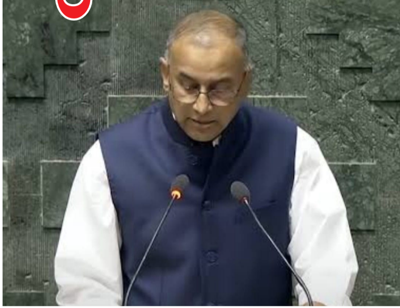
కల్పించడం ప్రధాన లక్ష్యమని తెలిపారు. ఈ ఏడాది నవంబర్ 1 నాటికి ఉజ్వల యోజన ద్వారా గృహ వినియోగం కోసం ప్రతి ఇంట్లోనూ కనీసం ఒక కేంద్రం ఏర్పాటు చేయాలని ప్రధాన మంత్రి ఆదేశించారు. దీనిని కేంద్ర పెట్రోలియం, సహజ వాయువుల శాఖల సహాయంతో సురక్షితంగా అందించాలని ఆదేశించారు. దీనిని కేంద్ర పెట్రోలియం, సహజ వాయువుల శాఖల సహాయంతో సురక్షితంగా అందించాలని ఆదేశించారు. దీనిని కేంద్ర పెట్రోలియం, సహజ వాయువుల శాఖల సహాయంతో సురక్షితంగా అందించాలని ఆదేశించారు.

సబ్సిడీని కొనసాగిస్తున్నామని తెలిపారు. అర్జులం దరికి లబ్ధి చేకూరలేదు. సామాజిక అవగాహన శిబిరాలతో వైతన్య పర్యవేక్షణను వివరించారు. వంట నూనె ధరల పెంపుతో సామాన్యులపై భారం.. ఇటీవల దేశంలో వంట నూనెల ధరలు పెరగడానికి కారణమైన అంశాలను కేంద్ర ప్రభుత్వం గుర్తించింది. అని ఖమ్మం ఎంపీ రామ సహాయం రఘురాం రెడ్డి లోక్ సభలో ప్రశ్నించారు. వంట నూనెల ధరల పెంపుతో సామాన్యులు, చిరు వ్యాపారులపై భారం పడుతోందని పేర్కొన్నారు. దీనికి గాను.. కేంద్ర వినియోగదారుల వ్యవహారాలు, ప్రజా పంపిణీ శాఖల సహాయంతో నిమిషాల్లోనే సమాధానమివ్వాలని ఖమ్మం ఎంపీ రామ సహాయం రఘురాం రెడ్డి లోక్ సభలో ప్రశ్నించారు. వంట నూనెల ధరలు పెరగడానికి కారణమైన అంశాలను కేంద్ర ప్రభుత్వం గుర్తించింది. అని ఖమ్మం ఎంపీ రామ సహాయం రఘురాం రెడ్డి లోక్ సభలో ప్రశ్నించారు. వంట నూనెల ధరలు పెరగడానికి కారణమైన అంశాలను కేంద్ర ప్రభుత్వం గుర్తించింది. అని ఖమ్మం ఎంపీ రామ సహాయం రఘురాం రెడ్డి లోక్ సభలో ప్రశ్నించారు.