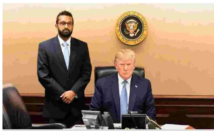
వాషింగ్టన్, నవంబర్ 7 : అమెరికా అధ్యక్ష ఎన్నికల ఫలితాలు వెలువడిన నాటి నుంచి కళ్ళవ పటేల్ ఎవరు? అనే ప్రశ్న ఎక్కువగా

వినిపిస్తోంది. త్వరలోనే అధ్యక్షుడిగా బాధ్యతలు చేపట్టనున్న డొనాల్డ్ ట్రంప్.. కళ్ళవ పటేల్ కు కీలకమైన సీఎంపి పూర్వీక డైరెక్టర్ గా బాధ్యతలు అప్పగించవచ్చంటూ కథనాలు వెలువడుతుండడంతో ఆయన గురించి ఆరా తీసేవారి సంఖ్య పెరిగింది. ముఖ్యంగా భారతీయులు ఆయనకు సంబంధించిన వివరాలను అన్వేషిస్తున్నారు. కళ్ళవ పటేల్ గుజరాతీ కుటుంబానికి చెందినవారు. ఆయన తల్లిదండ్రులు తూర్పు ఆఫ్రికాలో పెరిగారు. 1970 దశకంలో ఉగాండాలో ఇడి అమీన్ ప్రభుత్వం ఉన్న సమయంలో అమెరికాకు పారిపోయారని మీడియా కథనాలు చెబుతున్నాయి. కళ్ళవ పటేల్ 1980లో గార్డెన్ సిటీ న్యూయార్క్ లో పుట్టి పెరిగారు. హిందూవుగా పెరిగారు. రిచ్ మండ్ విశ్వ విద్యాలయంలో ఆందర్ గ్రాడ్యుయేట్