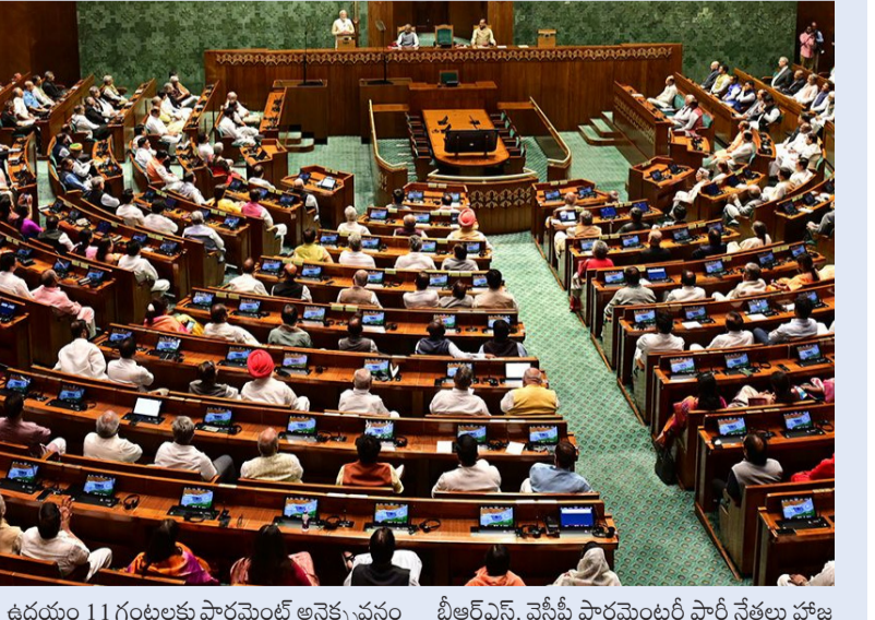
ఉదయం 11 గంటలకు పార్లమెంట్ అనెక్సవనల లో అఖిల పక్ష భేటీ జరిగింది. కేంద్ర మంత్రులు రాజ్యాంగ్ సింగ్, అమిత్ షా, కిరన్ రిజిజు, వివిధ పార్టీల పార్లమెంటు పార్టీ నేతలు హాజరయ్యారు. ఏపీ, తెలంగాణ నుంచి తెలుగు దేశం, జనసేన,

ముగిసిన అఖిల పక్ష సమావేశం వ్యాపార ప్రతిపక్షాలతో ప్రతిపక్షలు సిద్ధం. డిసెంబర్ 20 వరకూ పార్లమెంట్ సమావేశాలు రాజ్యాంగ దినోత్సవ వేడుకలు ఘనంగా నిర్వహిద్దామన్న అఖిల పక్షం పలు కీలక బిల్లులపై చర్చించాలన్న విషయకేంద్రం అదానీ లంచంపై పట్టుపట్టనున్న ఇండియా కూటమి పార్టీల వ్యాపారంతో రెడీగా ఉన్న ఏపీ ఎంపీలు తెలంగాణ ముచ్చట్లు, స్టేట్ బ్యూరో: మహారాష్ట్రలో మహాయతి ప్రభుత్వం... జార్జంట్ విజయంతో ఇండియా కూటమి జోరుమీదు న్నాయి. ఈ జరుకూటమిలా పార్లమెంట్ వేదికగా తమ సజ్జా నిరూపించుకునేందుకు సన్నద్ధం అవుతున్నాయి. పార్లమెంట్ శీతాకాల సమావేశాలు సోమవారం నుంచి ప్రారంభం కానున్న నేపథ్యంలో ఆదివారం అఖిల పక్ష సమావేశం జరిగింది. కేంద్ర ప్రభుత్వం తరఫున పార్లమెంటులో వ్యవహారాల శాఖ మంత్రి కిరన్ రిజిజు ఈ సమావేశం నిర్వహించారు.