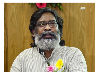
హేమంత్ సోరెన్ 39 వేలకుపైగా ఓట్ల మెజారిటీతో పునః విజయం సాధించారు.