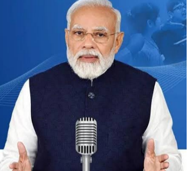
పూర్తి విశ్వాసంతో ఈ మాట మీకు చెబుతున్నాను. యువతలో క్రమశిక్షణ, సేవా గుణాన్ని, నాయకత్వ లక్షణాలను మరింత పెంపొందించడంలో దీని పాత్ర కీలకం అని ప్రధాని వ్యాఖ్యానించారు.

తెలంగాణ ముచ్చట్లు నేషనల్ బ్యూరో: ప్రధాని మోడీ ఆదివారం మన కీ బాత్ ధ్వారా ప్రజలతో మమేకమయ్యారు. నేషనల్ క్యాబిన్ట్ కార్మి దే సందర్భంగా ఆయన తన పాఠశాల రోజులను గుర్తు చేసుకున్నారు. దేశంలోని యువత కూడా ఎన్ సీసీ లో చేరాలని ప్రధాని కోరారు. జనవరి 12న వివేకానంద జయంతి. సందర్భంగా భారత్ మండపంలో యువజన ఆలోచనల మహాకుంభం ఉంటుందని ప్రధాని తెలిపారు. దీనికి 'డెవలప్ ఇండియా యంగ్ లీడర్స్ డైలాగ్' అని పేరు పెట్టబట్టి పేర్కొన్నారు. గయానా విదేశీ పర్యటనను కూడా మోడీ ప్రస్తావించారు. ఈ రోజు ఎన్సీసీ దినోత్సవం. ఇది ఎంతో ప్రత్యేకమైన రోజు. ఎన్సీసీ పేరు వినగానే మనందరికీ మన కాలేజీ, అలనాటి జ్ఞాపకాలు గుర్తుకు వస్తుంటాయి. నేను కూడా ఎన్సీసీ క్యాబిన్ట్. ఆ సమయంలో నేను పొందిన అనుభవం నాకెంతో అమూల్యమైంది.