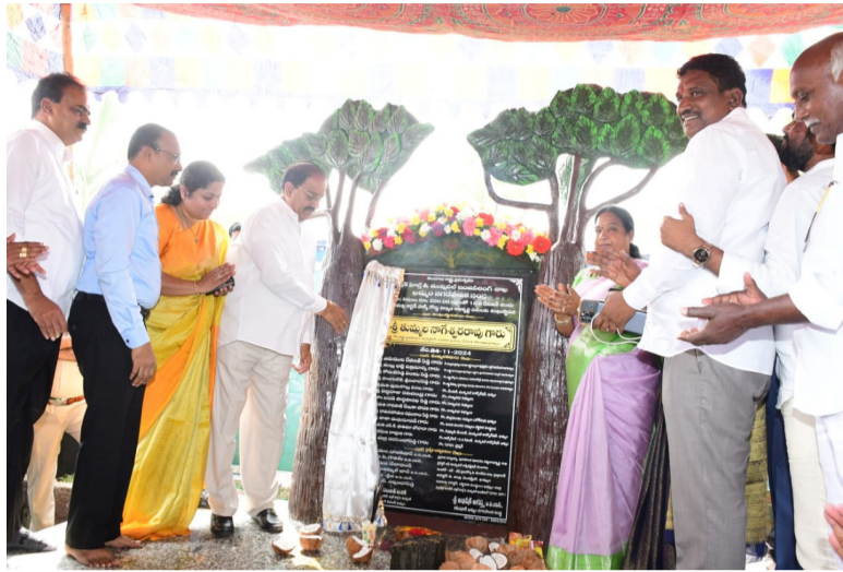
వెలుగుమట్ల అర్బన్ పార్కు కు వచ్చి కొంత సమయం ప్రశాంతంగా గడిపి విధంగా దీనిని అభివృద్ధి చేయాలని, వెలుగుమట్ల అర్బన్ పార్క్ స్థలం ఎక్కడి వరకు ఉందో సర్వే చేసి ప్రహారీ గోడ