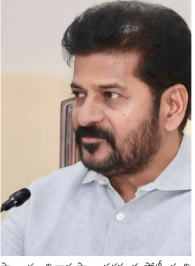
స్థాయి నుంచి రాష్ట్ర స్థాయి వరకు ఈ పోటీలను నిర్వహిస్తుంది. వైద్య ఆరోగ్య శాఖ పరిధిలో 16 కొత్త నర్సింగ్ కాలేజీలతో పాటు 28 పాఠా మెడికల్ కాలేజీలను

తెలంగాణ ముచ్చట్లు, స్టేట్ బ్యూరో: ప్రజా పాలన విజయోత్సవాల్లో భాగంగా తొమ్మిది రోజుల పాటు జరిగే వేడుకల ఏర్పాట్లలో రాష్ట్ర ప్రభుత్వం నిమగ్నమైంది. డిసెంబర్ ఒకటో తేదీ నుంచి 9వ తేదీ వరకు జరిగే ఈ వేడుకల్లో అభివృద్ధితో పాటు ప్రజా సంక్షేమ కార్యక్రమాలకు ప్రాధాన్యమివ్వాలని ముఖ్యమంత్రి ఎ.రేవంత్ రెడ్డి ఇప్పటికే అధికారులకు ఆదేశాలు జారీ చేశారు. ఈ మేరకు శాఖలవారీగా ఒకటో తేదీ నుంచి వరుసగా నిర్వహించే కార్యక్రమాల ప్రణాళికను అధికారులు నిర్ధారించేస్తున్నారు. ఇందులో భాగంగా రాష్ట్రంలో కొత్త ఇంటిగ్రేటెడ్ రెసిడెన్షియల్ స్కూల్స్ కాంప్లెక్స్ భవనాలకు భూమిపూజ నిర్వహిస్తారు. ఇప్పటికే 28 నియోజకవర్గాల్లో ఈ భవనాల పనులు మొదలయ్యాయి. మరో 26 నియోజకవర్గాల పరిధిలో ఇంటిగ్రేటెడ్ రెసిడెన్షియల్ స్కూళ్లను ప్రభుత్వం ఇటీవలే మంజూరు చేసింది. ప్రజా పాలన విజయోత్సవాల్లో పీటికి శంకుస్థాపన చేస్తారు. ఒకటో తేదీ నుంచి 7వ తేదీ వరకు అన్ని గ్రామాల్లో సీఎం కమిటీలను నిర్వహిస్తారు. గ్రామీణ ప్రాంతాల్లోని క్రీడా ప్రతిభను వెలుగులోకి తెచ్చే లక్ష్యంగా స్పోర్ట్స్ డెవలప్ మెంట్ కమిటీలను ఏర్పాటు చేశారు.