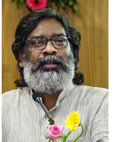
విజేఎస్ యూపీ 01, ఎల్ జేసీ ఆర్ పీ 01, జేకెఎల్ ఎం 01 జేడీయూ 01 స్థానం దక్కించుకున్నారు. ఎగ్జిట్ పోల్స్ అంచనాలు తారు మాడు చేస్తూ బీజేపీ కూటమిని జేఎంఎం

జార్జంట్, తెలంగాణ ముచ్చట్లు: జార్జంట్ ముఖ్యమంత్రిగా సోరెన్ మరోసారి ప్రమాణ స్వీకారం చేయనున్నారు. ఇందు కోసం ఈ నెల 26 ముహూర్తం ఖరారు చేసారు. రాంపేటలో జరిగే ప్రమాణ స్వీకారానికి కాంగ్రెస్ అగ్ర నేత రాహుల్ గాంధీతో పాటుగా పశ్చిమ బెంగాల్ సీఎం మమతా, ఇండియా కూటమి నేతలు హాజరు కానున్నారు. తాజాగా ఎన్సీకల ఫలితాల్లో బీజేపీ కూటమిని ఓడించిన జేఎంఎం కాంగ్రెస్ కూటమి అధికారిని నిలబెట్టుకుంది. మంత్రివర్గ కూర్పుపై సోరెన్ కన రత్న చేస్తున్నారు. జార్జంట్ ఎన్సీకల్లో అధికారం నిలబెట్టుకున్న హేమంత్ సోరెన్ నాలుగో సారి ముఖ్యమంత్రిగా ప్రమాణ స్వీకారం చేయనున్నారు. ఈ నెల 26న ప్రమాణ స్వీకారానికి ముహూర్తంగా నిర్ణయం తీసుకున్నారు. కాంగ్రెస్ కలిసి జేఎంఎం కూటమి ప్రభుత్వం ఏర్పాటు చేస్తోంది. గత ప్రభుత్వం లో మంత్రులుగా పని చేసిన ఓడిన సలగురికి తిరిగి కేబినెట్ లో అవకాశం ఇవ్వాలని సోరెన్ నిర్ణయించారు. తాజా ఎన్సీకల్లో జేఎంఎం 34, బీజేపీ 21, కాంగ్రెస్ 16, ఆర్డీఏ 04 సీట్లు (ఎంఎల్ఎ) (ఎల్) 02,