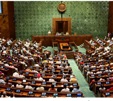
కళ్యాణ్ చర్చించారు. పార్లమెంటులో అనుసంధానించిన...