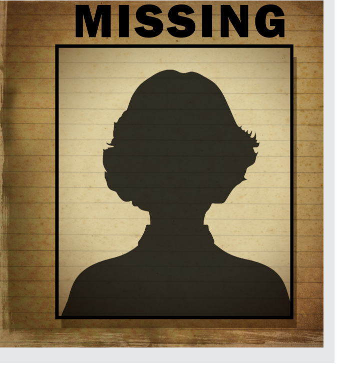
అదృశ్యం కేసుల్లో మహిళలే ఎక్కువ.. తెలంగాణ వ్యాప్తంగా

అదృశ్యమైన వారిలో బీసీ, ఎస్సీ, ఎస్టీలే ఎక్కువ అవుతో పిటిఎస్. ప్రభుత్వానికి హైకోర్టు మందలింపు తెలంగాణ రాష్ట్రంలో 'అదృశ్యం' కేసులు రోజురోజుకూ పెరుగుతున్నాయి. వయోభేదాలు లేకుండా ఇంటి నుంచి బయటికి వెళ్లిన వారు.. తిరిగి ఇంటికి చేరకుండా తప్పిపోతుండటం కలకలం రేపుతోంది. ప్రేమ పెరుతో కొందరు, ఇంట్లో పెద్దలు మందలింపారని ఇంకొందరు, కుటుంబ కలహాలు, ఆర్థిక ఇబ్బందులు, ఇతర కారణాలతో మరికొందరు కనిపించకుండా పోతున్నారు. ఇలా తప్పిపోతున్న వారి కుటుంబసభ్యులు సమీప బంధువులు, స్నేహితుల ఇళ్లలో వెతికినా ఫలితం లేక.. చివరకు పోలీసు స్టేషన్లలో 'మిస్సింగ్' కేసులు నమోదు చేస్తున్నారు. ఫిర్యాదు చేసి కళ్లు కాయలు కాయేలా ఎదురు చూసిన కొందరికి తమ కుటుంబసభ్యుల ఆచూకీ దొరకగా.. మరికొందరికి ఎదురుగా పుట్టి మిగిలాయి. తప్పిపోయిన వారిలో కొంతమంది ఆచూకీ పోలీసులు కనుగొన్నారు. మరి కొంతమంది ఆచూకీ మాత్రం దొరకడం లేదు. అదృశ్యం కేసులపై హైకోర్టు తీర్పు స్పందన అవ్వడం రాష్ట్రంలో పెరిగి మిస్సింగ్ కేసులపై హైకోర్టు