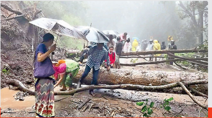
తెలంగాణ ముచ్చట్లు, తమిళనాడు: రాష్ట్రవ్యాప్తంగా రెండు రోజులుగా భారీ వర్షాలు కురుస్తుండటంతో లోతట్టు ప్రాంతాలు జలమయమయ్యాయి.