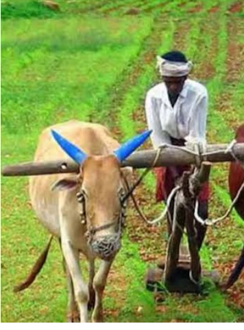
ప్రభుత్వం నిర్ణయించింది. సాగు భూముల లెక్కలో సుందీ నాన్ అగ్రికల్చర్ భూములను తీసేయ

మొదటి పేజీ తరువాయి... కోట్ల ఎకరాల్లో పంటలు సాగయ్యాయి. ఇందులో వరి, పత్తి పంటలే ఎక్కువ మొత్తంలో ఉన్నాయి. ఏ రైతు ఎన్ని ఎకరాల్లో ఏయే పంటలు వేసారో ఏఈఎల ఇప్పటికే ఆన్ లైన్ లో సమాచారం చేశారు.