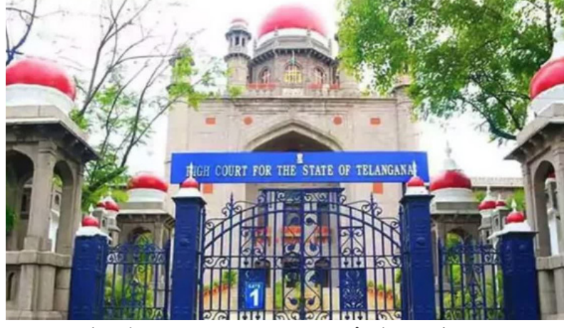
ప్రభుత్వం : హైకోర్టు ఆదేశాలపై తెలంగాణ రాష్ట్ర ప్రభుత్వం దేశంలో అత్యున్నత ధర్మాసనమైన సుప్రీం కోర్టును ఆశ్రయించింది. ఈ నేపథ్యంలో విచారణ

హైదరాబాద్ తెలంగాణ ముచ్చట్లు తెలంగాణ రాష్ట్ర ఎంబీబీఎస్, బీడీఎస్ విద్యార్థులకు హైకోర్టు బిగ్ లిఫ్ట్ను కల్పించింది. ఇతర రాష్ట్రాల్లో ఉన్నతమైన వైద్యవిద్య కోసం వెళ్లి చదువునభ్యసించిన తెలంగాణ విద్యార్థులను స్థానికంగా పరిగణించాలని ధర్మాసనం పెట్టింది. ఈ నేపథ్యంలో జీవో 140ని సవరించాలని రాష్ట్ర ప్రభుత్వానికి హైకోర్టు ఆదేశాలు జారీ చేసింది. స్థానికతపై అసలు వివాదమెందుకంటే? ఈ వివాదం ఎంబీబీఎస్, బీడీఎస్ స్టూడెంట్స్ అండ్ ప్రొఫెసర్స్ అసోసియేషన్ వారు తెలంగాణ రాష్ట్రంలో చదివిన వారిని స్థానికులుగా పరిగణించేలా ప్రభుత్వం జీవో నెంబర్ 33ను జారీ చేసింది. దీనిపై కొందరు వాదించారు. హైకోర్టును ఆశ్రయించారు. విచారణ చేపట్టిన ధర్మాసనం స్థానికతకు సంబంధించిన రూల్స్ అండ్ రెగ్యులేషన్స్ ను కొత్తగా రూపొందించాలని న్యాయస్థానం ప్రభుత్వాన్ని ఆదేశించింది. సుప్రీం కోర్టుకు సలహా