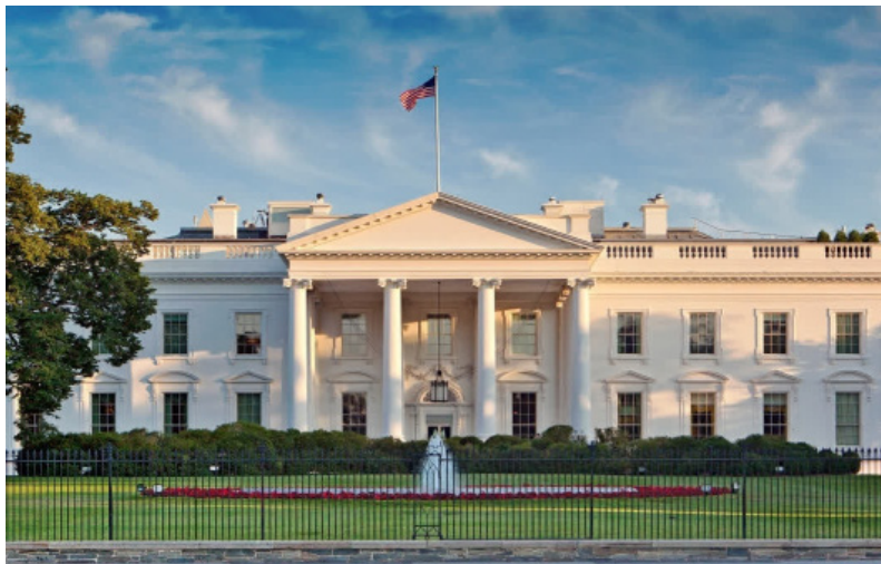
పట్ డౌన్ ప్రభావం ఎలా ఉంటుందంటే?

ప్రభుత్వ కార్యకలాపాలు, జీతాలకు సంబంధించిన కీలకమైన బిల్లు ఆమోదం పొందని నేపథ్యంలో అమెరికా పట్ డౌన్ ముప్పును ఎదుర్కొంటోంది. వాస్తవానికి తొలుత బైడెన్ ప్రభుత్వం తీసుకొచ్చిన బిల్లును డౌనాట్ ట్రంప్ తిరస్కరించారు. దీంతో ప్రతినిధుల సభ స్పీకర్ మైక్ జాన్సన్ మార్చి 14వ తేదీ వరకు ప్రభుత్వానికి నిధులు సమకూర్చేలా సరికొత్త బిల్లును ప్రవేశ పెట్టారు. రెండేళ్లపాటు రుణాలపై సీలింగ్ గునసస్పౌండ్ చేయడం మొదలైన ట్రంప్ డిమాండ్లను ఇందులో చేర్చారు. దీంతో కాబోయే అధ్యక్షుడైన డౌనాట్ ట్రంప్ ఈ బిల్లుకు మద్దతు తెలుపుతూ, మిగిలినవారు కూడా సానుకూలంగా ఓటియాలని పేలుతున్నప్పుడు, దీనిని డెమోక్రాట్ల తీవ్రంగా వ్యతిరేకించారు. పైగా ప్రతినిధుల సభ కూడా దీనిని 235174తో తిరస్కరించింది. అంతేకాదు ఏకంగా 38 మంది రిపబ్లికన్ సభ్యులే డెమోక్రాట్లతో కలిసి బిల్లుకు మద్దతుగా ఓటికారు. మరోవైపు ప్రస్తుతానికి సెనేట్లో డెమోక్రాట్ల పట్టు కొనసాగుతోంది. దీంతో చుక్కవారం రాత్రిలోగా ప్రభుత్వానికి నిధులు సమకూరడంలో కాంగ్రెస్ వివేక మైతే అమెరికా ప్రభుత్వం పట్ డౌన్ ఎదుర్కోక తప్పని పరిస్థితి నెలకొంది.