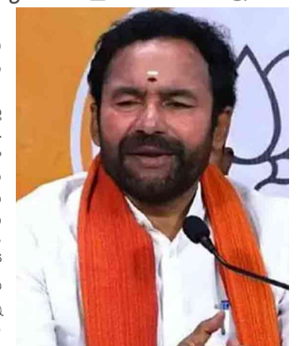
ఎగుమతి అవుతున్నాయని కిషన్ రెడ్డి వ్యాఖ్యానించారు. మన దేశంలో 5జి నేపథ్యం అందుతున్నాయి.. చాలా

హైదరాబాద్, తెలంగాణ ముచ్చట్లు: రోజ్ గార్ మేళాలో కేంద్రమంత్రి కిషన్ రెడ్డి పాల్గొని ఉద్యోగాలు పొందిన వారికి నియామక పత్రాలు అందజేత. ఈ సందర్భంగా కేంద్ర మంత్రి కిషన్ రెడ్డి మాట్లాడుతూ.. 10 రోజ్ గార్ మేళాలు పూర్తి అయ్యాయి.. ఇది 11 వ మేళా అని ఆయన అన్నారు. ఈ రోజుల్లో (ఈ 11 మేళాల్లో) కలుపుకొని సుమారుగా పది లక్షల కేంద్ర ప్రభుత్వ ఉద్యోగాలు భర్తీ చేశామన్నారు కిషన్ రెడ్డి. ప్రతి నెల ఉద్యోగ నియామకాలు జరగాలి, ఖాళీలు ఉండొద్దు అని ప్రధాని ఆదేశాలు ఇచ్చారన్నారు. అందుకే రెగ్యులర్ గా నియామకాలు జరుగుతున్నాయని ఆయన తెలిపారు. గతంలో ఉద్యోగ నియామకాల్లో అవినీతి జరిగింది.. ఇప్పుడు పూర్తిగా పారదర్శకంగా నియామకాలు జరుగుతున్నాయని, నా మంత్రిత్వ శాఖలో మొత్తం రెగ్యులర్ కాంట్రిబ్యూషన్ కలిపి 8 లక్షల ఉద్యోగులు ఉంటారు.. ఖాళీలను భర్తీ చేస్తున్నామన్నారు కిషన్ రెడ్డి. కరోనాతో ఎన్నో దేశాల ఆర్థికంగా అతలాకుతలం అయ్యాయని, మన దేశంలో 5జి నేపథ్యం అందుతున్నాయి.. చాలా