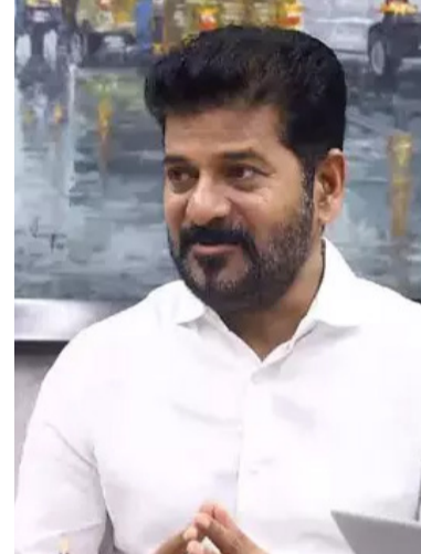
టీవీలో పేర్కొన్నారు. ఈ నేపథ్యంలో అల్లు అర్జున్ నేడు పోలీసుల విచారణకు సంబంధించి లీగల్ డివీనియన్స్ తీసుకుంటున్నారు.

హైదరాబాద్, తెలంగాణ ముచ్చట్లు: సీసీ నటుడు అల్లు అర్జున్ వ్యవహారంపై తెలంగాణ సీఎం రేవంత్ రెడ్డి మంత్రులకు, పార్టీ నేతలకు కీలక ఆదేశాలు జారీ చేశారు. అల్లు అర్జున్ వ్యవహారంలో ఎవరూ ఏమీ మాట్లాడవద్దని ముఖ్యమంత్రి ఆదేశించారు. మీడియా సమావేశాలు, టీవీ చర్చల్లో కూడా అల్లు అర్జున్ వ్యవహారంపై పార్టీకి చెందిన నేతలు ఎవరూ మాట్లాడవద్దన్నారు. ఈ మేరకు పార్టీ నాయకులు మాట్లాడకుండా చూడాలని తెలంగాణ పీసీసీకి సీఎం సుప్రమైన్ సూచనలు ఇచ్చారు. లీగల్ టీంతో భేటీ అయిన అల్లు అర్జున్ అల్లు అర్జున్ తన లీగల్ టీంతో భేటీ అయ్యారు. పుష్య 2 టీవీ టీం సందర్భంగా సంద్య థియేటర్ లో తొక్కిసలాట జరిగిన ఘటనలో ఒకరు మృతి చెందగా, మరొకరు ఆసుపత్రిలో చికిత్స పొందుతున్నారు. ఈ ఘటనకు సంబంధించి విచారణ జరిపేందుకు చిక్కడపల్లి పోలీసులు అల్లు అర్జున్ ను నోటీసులు జారీ చేశారు. నేడు ఉదయం 11 గంటలకు విచారణకు రావాలని సో