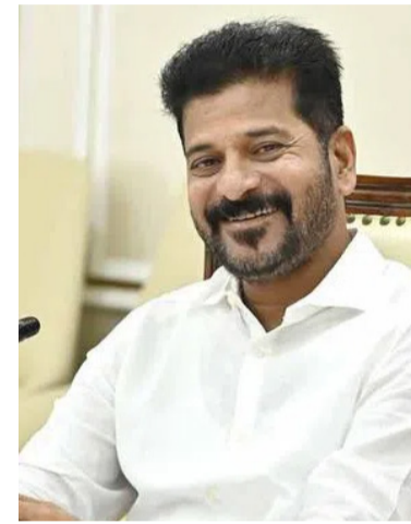
ద్వైత అందరు పాటుపడాలని అన్నారు. రాష్ట్రమంతటా క్రిస్మస్ వేడుకలను ఆనందంగా జరుపుకోవాలని ముఖ్యమంత్రి రేవంత్ రెడ్డి పిలుపునిచ్చారు.

క్రిస్మస్ పర్వదినం సందర్భంగా ముఖ్యమంత్రి రేవంత్ రెడ్డి క్రిస్టియన్ సోదరులకు, సోదరిమణులకు శుభాకాంక్షలు తెలిపారు. ఏనుక్రిస్తు బోధనలు ఇప్పటికీ.. ఎప్పటికీ ప్రపంచంలోని మానవాళికి మార్గదర్శకమని అన్నారు. అన్ని మతాల సారాంశం మానవత్వమేనని అయిన ఎంచుకున్న మార్గం అందరికీ దిక్సూచిగా నిలుస్తోందన్నారు. ఇతరుల పట్ల ప్రేమ, సహనం, శాంతి, సేవాభావం వంటి గొప్ప గుణాలను ఆచరించాలని.. శాంతి దూత ఇచ్చిన సందేశం మనందరికీ ఆదర్శంగా నిలుస్తుందని ముఖ్యమంత్రి అన్నారు. ఏనుక్రిస్తు బోధనలను అనుసరించి అన్ని మతాల సంక్షేమం, అభివృద్ధికి ప్రజా ప్రభుత్వం కట్టుబడి ఉంటుందని తెలిపారు. క్రిస్టియన్ మైనారిటీల సర్వతోముఖాభివృద్ధికి రాష్ట్ర ప్రభుత్వం కట్టుబడి ఉంటుందన్నారు. క్రిస్టియన్ సోదరులు సంతోషముతో, ఆనందోత్సాహంతో క్రిస్మస్ ను జరుపుకోవాలని, క్రిస్మస్ అనుసరించిన మార్గాన్ని అనుసరించి సమాజ అభివృద్ధి