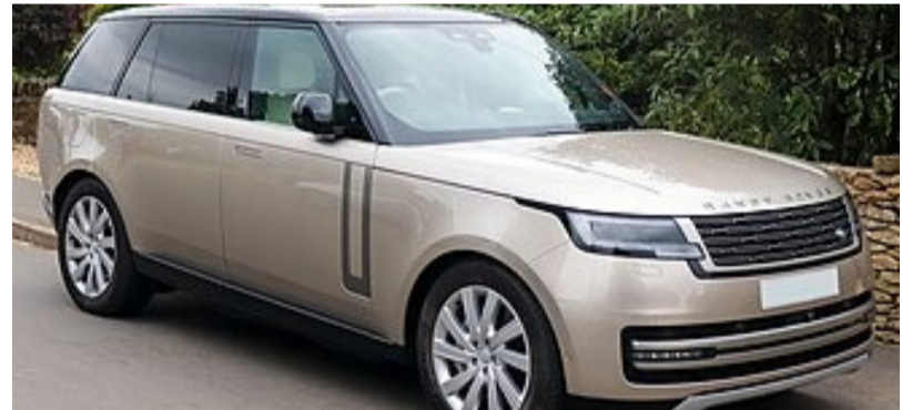
దీంతో హైఎండ్ మోడల్లైన రేంజ్ రోవర్ ఆటోబయోగ్రాఫీ, ఎన్ఎస్ఎడ్ఎస్ వంటి వేరియంట్ల ధరలు 13 నుంచి 25 శాతం వరకు తగ్గనున్నాయి. ప్రస్తుతం రూ. 2.75 కోట్లకు ఉన్న ఒక మోడల్ ధర సుమారు రూ. 2.35 కోట్లకు చేరే అవకాశం ఉండగా.. రూ. 4.25

న్యూఢిల్లీ, ఏప్రిల్ 3 (తెలంగాణ ముచ్చటలు): భారత్ యూకే మధ్య కుదిరిన స్వేచ్ఛా వాణిజ్య ఒప్పందం ప్రభావంతో లగ్జరీ కార్ల మార్కెట్లో భారీ మార్పులు చోటుచేసుకోబోతున్నాయి. ముఖ్యంగా రేంజ్ రోవర్ కార్ల ధరలు గణనీయంగా తగ్గనున్నాయి. జాగ్యూర్ ల్యాండ్ రోవర్ (జెఎల్ఆర్) తీసుకున్న తాజా నిర్ణయం ప్రకారం యూకే నుంచి పూర్తిస్థాయిలో దిగుమతి అయ్యే టాప్ ఎండ్ మోడల్లపై ధరలు భారీగా తగ్గే అవకాశం ఉంది. దిగుమతి నుండి 110 శాతం నుంచి 30 శాతానికి తగ్గించడంతో ఈ మార్పులు చోటుచేసుకుంటున్నాయి.