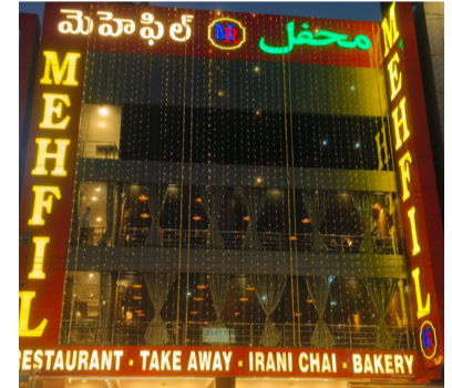
ఏర్పడుతున్నాయని స్థానికులు ఆవేదన వ్యక్తం చేశారు.

వారు డిమాండ్ చేశారు. అలాగే పాత చిక్కిన, పాడైన బిర్యానీని ఫ్రీజ్ లో నిల్వ చేసి మరుసటి రోజు వినియోగదారులకు అందిస్తున్నారనే అనుమానం వ్యక్తం చేశారు. ఈ ఘటనపై పుడి సేఫ్టీ అధికారులు, పోలీసులు వెంటనే చర్యలు తీసుకోవాలని కోరారు. ఫిర్యాదు అందుకున్న కుషామగూడ పోలీసులు రెస్టారెంట్ నిర్వాహకులను అదుపులోకి తీసుకుని విచారణ కోసం పోలీస్ స్టేషన్ కు తరలించారు. ఇక్కడ రెస్టారెంట్ ముందు ఫుట్ పాత్ పై వాహనాలు నిలవడం వల్ల తరచూ ట్రాఫిక్ సమస్యలు