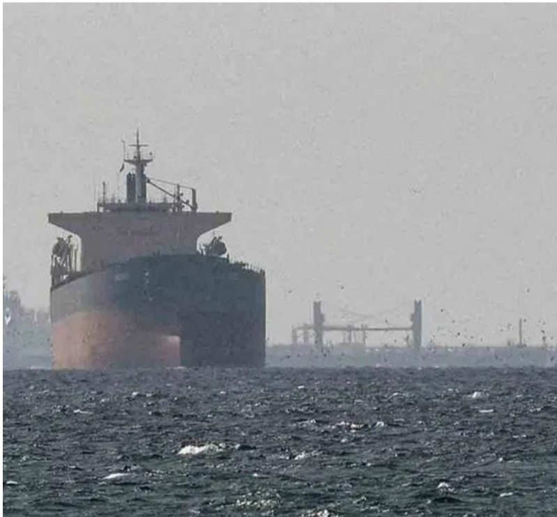
తనకు తెలియపని పేర్కొన్నారు. భారత్ ఇరాన్ సంబంధాలు బలంగా ఉన్నాయని, ఈ సమస్య త్వరలో పరిష్కారమవుతుందని ఆశాభావం వ్యక్తం చేశారు.