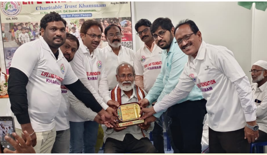
Charitable Trust Khammam... LIVING FOUNDATION KHAMMAM... ELUNDUKUN KHAMMAM... LIFE FOUNDATION KHAMMAM

గ్రామంలోని యువతను కాంగ్రెస్ పార్టీ బలోపేతానికి సమీకరిస్తానని హామీ ఇచ్చారు. గ్రామ ప్రజల సమస్యలను పార్టీ నాయకుల దృష్టికి తీసుకెళ్లి పరిష్కారం కోసం నిరంతరం పని చేస్తానని చెప్పారు. అలాగే పార్టీ సిద్ధాంతాలను ప్రతి ఇంటికీ తీసుకెళ్లి గ్రామంలో కాంగ్రెస్ పార్టీని మరింత బలోపేతం చేసే దిశగా పనిచేస్తానని తెలిపారు. ఈ కార్యక్రమంలో గ్రామ కమిటీ సభ్యులు, యువజన నాయకులు, పార్టీ కార్యకర్తలు మరియు పలువురు గ్రామ పెద్దలు పాల్గొన్నారు. నూతన యూత్ అధ్యక్షుడి ఎన్నికతో గ్రామంలో కాంగ్రెస్ శ్రేణుల్లో కొత్త ఉత్సాహం నెలకొంది.