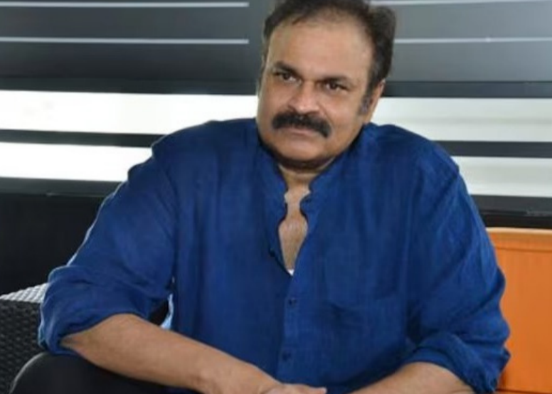
ఇంటెన్స్ లుక్లో కనిపిస్తూ సినిమాపై అంచనాలను పెంచేశారు. ఇప్పటివరకు ఎన్నో విభిన్న పాత్రలతో ప్రేక్షకులను ఆకట్టుకున్న నాగబాబు, ఈ సినిమాలో మరో కొత్త కోణాన్ని చూపించబోతున్నట్లు తెలుస్తోంది. సామాజిక అంశాలతో కూడిన ఈ చిత్రం విడుదలకు ముందే మంచి హైప్ సృష్టించడంతో సినీ వర్గాల్లో ఆసక్తి నెలకొంది.