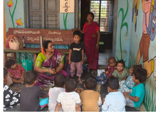
స్వన్న పౌష్టికాహారం వివరాలను అడిగి తెలుసుకున్నారు. అంగన్వాడీ టీచర్లు, ఆయాలు ఎలాంటి అక్రమ చెల్లింపులు చేస్తున్నారా