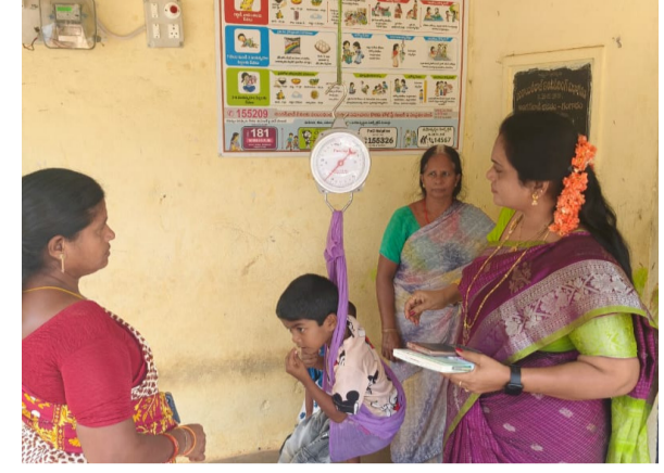
అని ప్రశ్నించగా, అలాంటివి ఏవీ లేవని నిబ్బంది తెలిపారు. ఈ సందర్భంగా విజేత మాట్లాడుతూ, ఎక్కడైనా విధుల్లో నిర్లక్ష్యం

ఉంటే కఠిన చర్యలు తప్పవు అని హెచ్చరించారు. తనిఖీల్లో ఎలాంటి లోపాలు కనిపించలేదని, కేంద్రాల పనితీరు బాగుందని తెలిపారు.