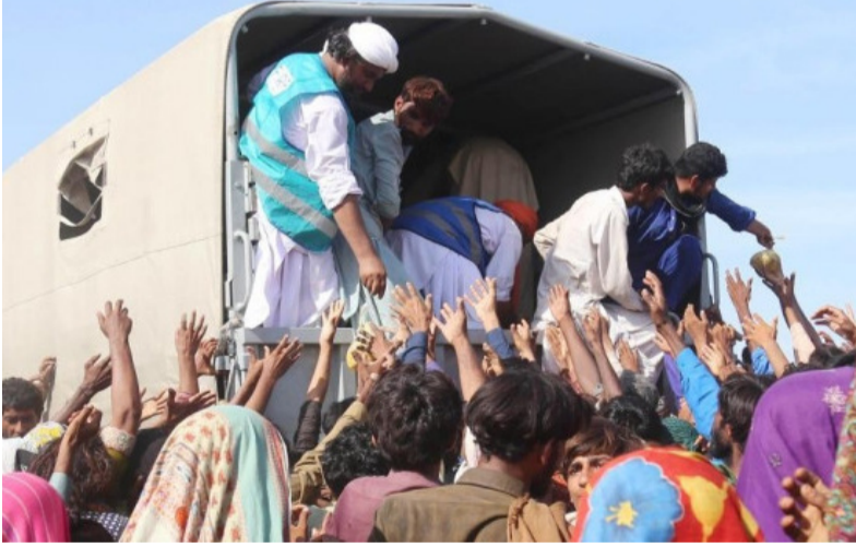
తీవ్రమైన వాతావరణ మార్పుల వల్ల నివేదిక వెల్లడించింది. 2025లో సంభవించిన భారీ వర్షాలు, ఆకస్మిక వరదల వల్ల 60 లక్షల మందికి పైగా ప్రజలు ప్రభావితమయ్యారు. పంట పొలాలు, మౌలిక సదుపాయాలు దెబ్బతినడంతో ఆహార ఉత్పత్తి తగ్గిపోయింది.

ఇస్లామాబాద్, ఏప్రిల్ 26 (తెలంగాణ ముచ్చటలు): పొరుగు దేశం పాకిస్థాన్ లో ఆహార సంక్షోభం తీవ్రమైంది. ఐక్యరాజ్యసమితి మద్దతుతో విడుదలైన "2026 గ్లోబల్ రిపోర్ట్ ఆన్ ఫుడ్ సెక్యూరిటీ" ప్రకారం ప్రపంచంలో అత్యంత తీవ్రమైన ఆహార కొరతను ఎదుర్కొంటున్న దేశాల జాబితాలో పాకిస్థాన్ కూడా ఉంది. నివేదిక ప్రకారం దేశంలో సుమారు 1.1 కోట్ల మంది ప్రజలు తీవ్రమైన ఆహార కొరతతో బాధపడుతున్నారు. అందులో 93 లక్షల మంది సంక్షోభ స్థితిలో, 17 లక్షల మంది అత్యవసర స్థితిలో ఉన్నట్లు పేర్కొంది. పాకిస్థాన్ లో ఈ పరిస్థితికి ప్రధాన కారణం