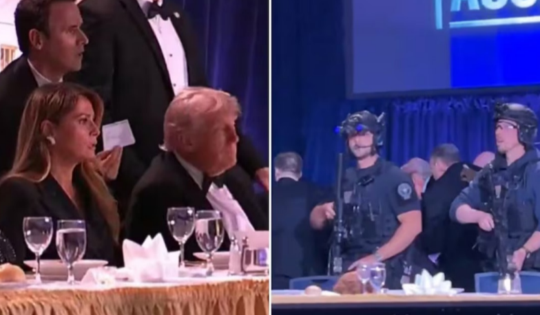
పినట్లు అధికారులు తెలిపారు. దాడిలో ఒక భద్రతా అధికారి లక్ష్యంగా మారినప్పటికీ బుల్లెట్ ప్రూఫ్ వెస్ట్ ధరించి ఉండటంతో ప్రాణాపాయం తప్పింది. వెంటనే అప్రమత్తమైన సీక్యూరిటీ సిబ్బంది అధ్యక్షుడిని భద్రతా పలయంలోకి

వాషింగ్టన్, ఏప్రిల్ 26 (తెలంగాణ ముచ్చటలు): అమెరికాలో వైట్ హౌస్ కరస్పాండెంట్స్ అసోసియేషన్ వార్షిక విందు సందర్భంగా కాల్పులు ఘటన చోటుచేసుకుని ఉద్రిక్తత నెలకొంది. కార్యక్రమానికి హాజరైన అధ్యక్షుడు డొనాల్డ్ ట్రంప్ సురక్షితంగా బయటపడ్డారు. వివరాల ప్రకారం కార్యక్రమం జరుగుతున్న సమయంలో ఓ వ్యక్తి కాల్పులకు పాల్పడడంతో ఒక్కసారిగా గందరగోళం ఏర్పడింది. భద్రతా సిబ్బందిపై లక్ష్యంగా కాల్పులు జరి