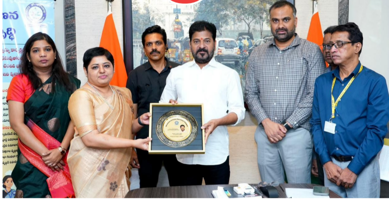
ప్రభుత్వం ఆశాభావం వ్యక్తం చేసింది. మాన్యువల్ విజయవంతం చేయాలని అధికారి ప్రజలు పెద్ద ఎత్తున పాల్గొని ఈ కార్యక్రమం ప్రజలు పెద్ద ఎత్తున పాల్గొని ఈ కార్యక్రమం

మొదటి సంవత్సరం ఒక కుటుంబం సమాధి చేయాలని, తుది సమర్పణకు ముందు వివరాలను జాగ్రత్తగా పరిశీలించాలని చెప్పారు. స్వీయ గణన చేసినప్పటికీ ఎన్యూమరేటర్ గృహ సందర్శన కొనసాగుతుందని అధికారులు స్పష్టం చేశారు. ఎన్ఈఐడి ఆధారంగా వివరాలు ధృవీకరించి అవసరమైతే సవరణలు చేస్తారని తెలిపారు. ఈ విధానం ద్వారా ఖచ్చితమైన జనాభా డేటా సేకరణ సాధ్యమవుతుందని పేర్కొన్నారు. డిజిటల్ విధానాలను వినియోగిస్తూ పారదర్శక పరిపాలనను బలోపేతం చేసే దిశగా జనగణన-2027 ఒక కీలక మైలురాయిగా నిలవనుందని