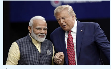
క్షేమంగా ఉన్నారని తెలిసి ఊరట కలిగిందని తెలిపారు. వారి భద్రత కోసం శుభాకాంక్షలు తెలియజేశారు. ఇక ఈ ఘటనపై డొనాల్డ్ ట్రంప్ మాట్లాడుతూ ఆయుధాలతో

రేపింది. వెంటనే అప్రమత్తమైన భద్రతా సిబ్బంది ట్రంప్ దంపతులు, ఇతర ప్రముఖులను సురక్షిత ప్రాంతానికి తరలించారు. పరిస్థితి ఉద్రిక్తంగా మారడంతో విందును నిలిపివేశారు. ఈ ఘటనపై నరేంద్ర మోదీ సామాజిక మాధ్యమ వేదిక ద్వారా స్పందిస్తూ ట్రంప్, ఆయన కుటుంబ సభ్యులు