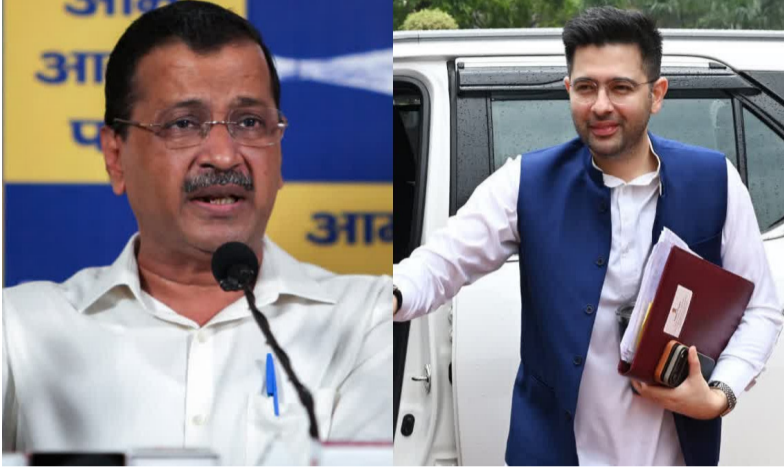
చేశారు. గతంలో ఆమ్ పార్టీకి చెందిన రాఘవ్ చద్దా, అశోక్ మిశ్రా, సందీప్ పాఠక్, హర్ష జన్ సింగ్, రాజేంద్ర గుప్త, విక్రమ్ సాహ్ని, స్వాతి మలివాలే పార్టీని వీడి బీజేపీలో చేరిన విషయం తెలిసింది. ఈ పరిణామం ఆమ్ కు పెద్ద ఎదురుదెబ్బగా మారింది. ఈ చేరికలను సమర్థిస్తూ రాఘవ్ చద్దా కీలక వ్యాఖ్యలు చేశారు. రాజ్యాంగం ప్రకారం ఒక

న్యూఢిల్లీ, ఏప్రిల్ 26 (డిజైన్ టెక్ గురు ప్రతినిధి): ఆమ్ అడ్మినిస్ట్రేషన్ చెందిన ఏడుగురు రాజ్యసభ సభ్యులు బీజేపీలో చేరిన ఘటనపై రాజకీయంగా తీవ్ర చర్చ కొనసాగుతోంది. ఈ నేపథ్యంలో ఆమ్ ఎంపీల సంజయ్ సింగ్ రాజ్యసభ చైర్మన్ సీపీ రాధాకృష్ణన్ కు పిటిషన్ సమర్పించి, ఫిరాయింపిన సభ్యులను అనర్హులుగా ప్రకటించాలని కోరారు. ఈ సందర్భంగా సంజయ్ సింగ్ మాట్లాడుతూ, ఆ ఎంపీల చర్చ పార్టీ ఫిరాయింపు నిరోధక చట్టానికి విరుద్ధమని ఆరోపించారు. ప్రజల తీర్మానం అవమానించిన ఈ చర్చపై కఠిన చర్యలు తీసుకోవాలని డిమాండ్ చేశారు.