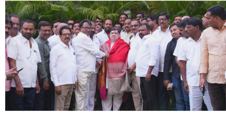
కార్మికులకు గుర్తింపు సంఘాల ఎన్నికల నిర్వహణ చేపట్టడం పట్ల సంఘాల సంతోషం వ్యక్తం చేశాయి. ఉద్యోగ హక్కుల పరిరక్షణకు ఇది కీలకమని పేర్కొన్నారు. ఆర్టీసీ కార్మి

హైదరాబాద్, ఏప్రిల్ 26 (తెలంగాణ ముచ్చటలు): ఆర్టీసీ కార్మికుల సమస్యల పరిష్కారానికి ప్రభుత్వం తీసుకున్న నిర్ణయాల నేపథ్యంలో మినిస్టర్ క్వార్టర్స్ లో ఆర్టీసీ జేఎస్ నేతల మంత్రి పొన్నం ప్రభాకర్ ను సత్కరించి ధన్యవాదాలు తెలిపారు. ఈ సందర్భంగా కార్యక్రమం ప్రతినిధులు ప్రభుత్వ చర్యలను అభినందించారు. ప్రభుత్వం తీసుకున్న నిర్ణయాలతో ఆర్టీసీ కార్మికుల చిరకాల సమస్యల నెరవేరిందని సంఘాల నేతలు పేర్కొన్నారు. ఆర్టీసీ ప్రభుత్వంలో విలీనం చేయడం వల్ల కార్మికులకు భద్రత పెరిగిందని అభిప్రాయపడ్డారు.