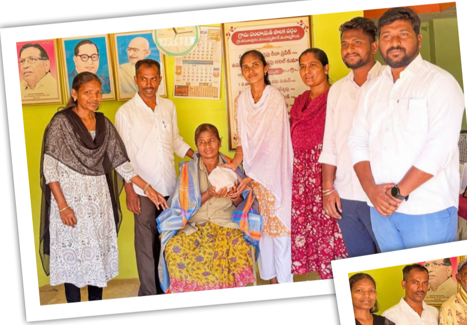
ధర్మసాగర్, మే01(తెలంగాణ ముచ్చట్లు):