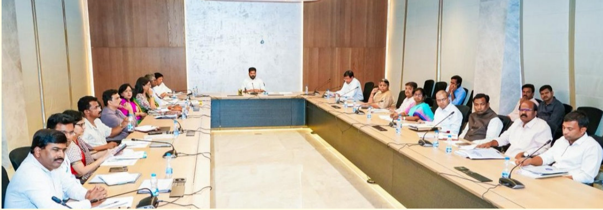
హైదరాబాద్, ఏప్రిల్ 30 (తెలంగాణ ముచ్చాట్లు): రాష్ట్రంలోని విద్యార్థుల సంక్షేమాన్ని దృష్టిలో ఉంచుకుని వారికి అవసరమైన అన్ని విద్యా సౌకర్యాలను సకాలంలో అందించేలా చర్యలు చేపట్టాలని ముఖ్యమంత్రి రేవంత్ రెడ్డి ఆధికారులను ఆదేశించారు.

సామగ్రి సమయానికి అందించాలి నాణ్యతతో పాటు సమయపాలనపై ముఖ్యమంత్రి ఆదేశాలు అన్ని శాఖల సమన్వయానికి ప్రత్యేక కమిటీ జూన్ 15 నాటికి పూర్తి పంపిణీ లక్ష్యం