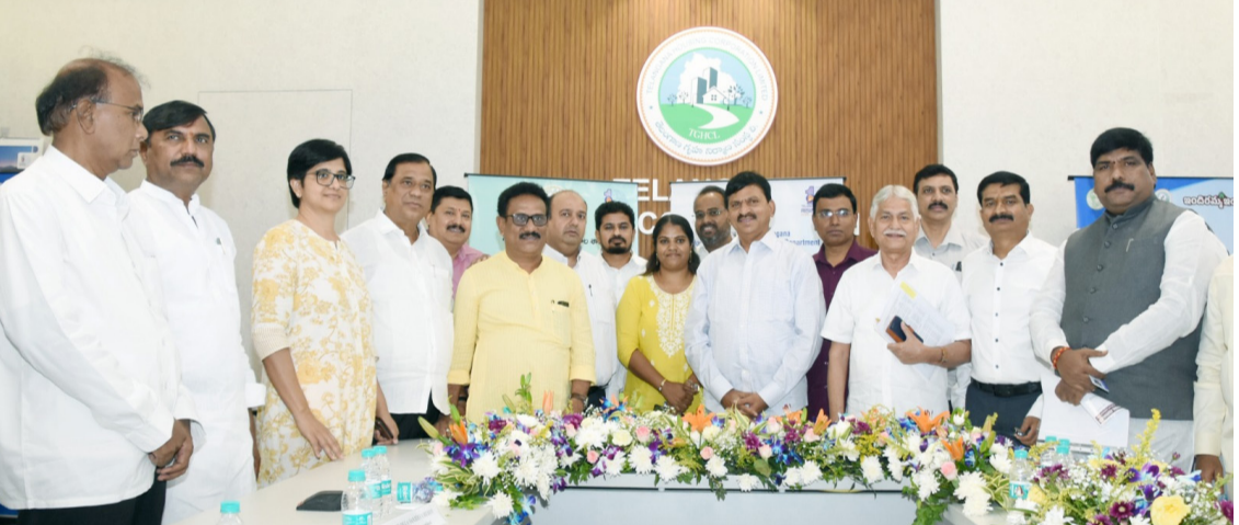
హైదరాబాద్, ఏప్రిల్ 30 (తెలంగాణ ముచ్చాట్లు): తెలంగాణ రాష్ట్ర గనల శాఖ మంత్రి పొంగులేటి శ్రీనివాస్ రెడ్డి జర్నలిస్టుల గుర్తింపుకు ప్రభుత్వం ప్రాధాన్యం ఇస్తోందని పేర్కొన్నారు. రాష్ట్రంలో

సుమారు 46 వేల మంది జర్నలిస్టులకు అక్రిడేషన్ కార్డులు జారీ చేయడం దేశంలోనే ప్రత్యేకమైన చర్యగా నిలుస్తుందని తెలిపారు. హిమాయత్ నగర్లోని రాష్ట్ర హౌసింగ్ కార్పొరేషన్ కార్యాలయం