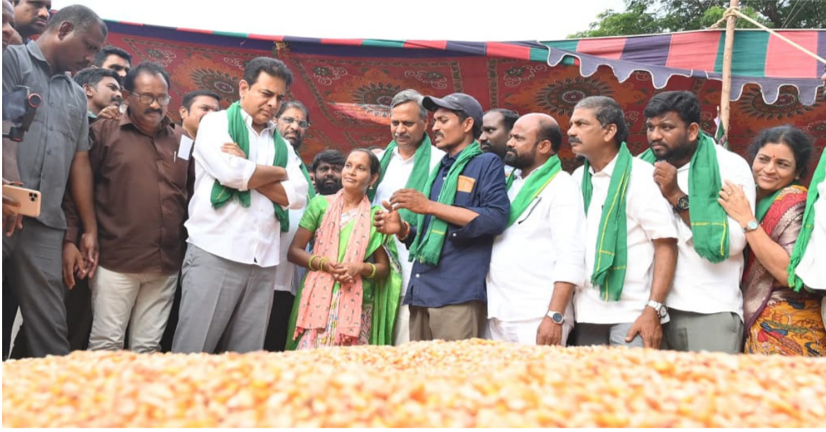
రైతులు నష్టపోతున్న పరిస్థితిని తక్షణమే పరిష్కరించాలని సూచించారు. రైతుల సమస్యలపై ప్రభుత్వం తక్షణ స్పందన చూపాలని