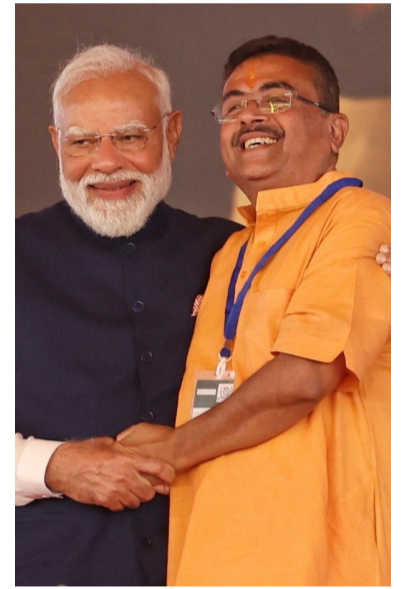
ఈ ఎన్నికలు ముగింపు పలికాయి. ముఖ్యమంత్రి మమతా బెనర్జీ ఆధిపత్యానికి గండి పడడంతో బెంగాల్ రాజకీయ సమీకరణం

బ్రిగేడ్ పరేడ్ గ్రౌండ్ లో ఘన కార్యక్రమం మోడీ సమక్షంలో బాధ్యతలు చేపట్టిన సువేందు మమతా ఆధిపత్యానికి ముగింపు పలికిన ఎన్నికలు