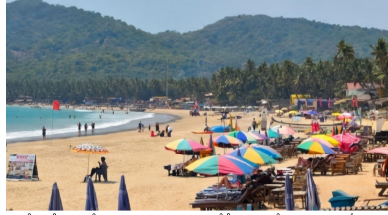
45 కేసుల్లో మాత్రమే వారు బాధితులుగా ఉన్నారు. ముఖ్యంగా 2024లో విదేశీయులు పాల్పడిన నేరాలు 27 శాతం పెరిగినట్లు అధికారులు గుర్తించారు. హత్యాయత్నం, అత్యాచారం, మోసం, దాడులు, ఫారినర్స్ యాక్ట్ ఉల్లంఘనలు, మాదకద్రవ్యాల అమ్మకం, రవాణా పంటి తీవ్రమైన నేరాల్లో

ప్రపంచ ప్రసిద్ధ పర్యాటక కేంద్రంగా పేరొందిన గోవాలో విదేశీయులకు సంబంధించిన నేరాల అంశం ఆందోళనకలిగిస్తోంది. విదేశీయులపై జరిగిన నేరాల కంటే, వారే స్వయంగా పాల్పడుతున్న నేరాల అధికంగా ఉన్నాయని జాతీయ నేర గణాంక సంస్థ నివేదికలు వెల్లడిస్తున్నాయి. 2022 నుంచి 2024 మధ్యకాలంలో విదేశీయులు బాధితులుగా ఉన్న కేసులతో పోలిస్తే, నిందితులుగా సమాధానం కేసులు ఆరు రెట్లు ఎక్కువగా ఉన్నట్లు గణాంకాలు చెబుతున్నాయి. గోవాలో పెరుగుతున్న నేరాల భారంపై ఈ వివరాలు ఆందోళనకలిగిస్తున్నాయి. ఎస్పీ ఆర్ డేటా ప్రకారం గత మూడు సంవత్సరాల్లో గోవా పోలీసులు విదేశీయులకు సంబంధించిన మొత్తం 251 కేసులు నమోదు చేశారు. వీటిలో 206 కేసుల్లో విదేశీయులే నిందితులుగా ఉండగా, కేవలం