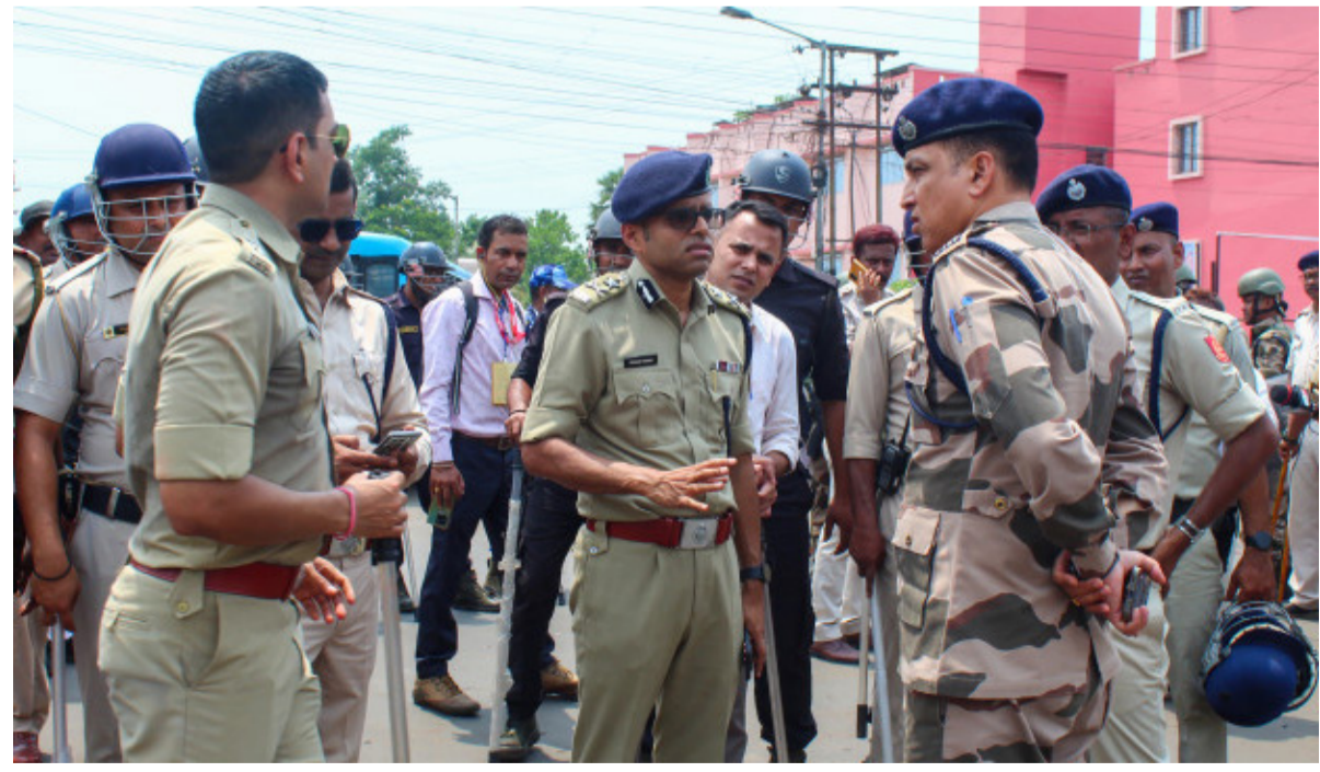
స్వీకార కార్యక్రమానికి ప్రధాని మోదీ, అమిత్ షా సహా పలువురు కేంద్ర మంత్రులు, బీజేపీ చీఫ్ ముఖ్యమంత్రి నారా చంద్రబాబు నాయుడు తదితరులు హాజరయ్యారు. మరోవైపు సువేందు ప్రమాణ స్వీకారం అనంతరం మమతా బెనర్జీ తన సోషల్ మీడియా ఖాతాలనుంచి "ముఖ్యమంత్రి" హోదాను తొలగించడం కూడా ప్రాధాన్యం సంతరించుకుంది. ఇవాళ సువేందుతో పాటు మరో ఐదుగురు మంత్రులు కూడా ప్రమాణ స్వీకారం చేశారు. వారిలో మహిళా నేత అగ్నిమిత్రా

పశ్చిమ బెంగాల్ లో అధికార మార్పుతో ప్రభుత్వ వ్యవస్థలో మార్పులు స్పష్టంగా కనిపిస్తున్నాయి. రాష్ట్ర నూతన ముఖ్యమంత్రిగా సువేందు అధికారి ప్రమాణ స్వీకారం చేసిన వెంటనే కోల్ కతా పోలీసులు తమ అధికారిక ఎక్స్ ఖాతాల్లో కీలక మార్పులు చేశారు. మాజీ ముఖ్యమంత్రి మమతా బెనర్జీ, తృణమూల్ కాంగ్రెస్ నేత అభిషేక్ బెనర్జీలను అన్ ఫోలో చేసిన కోల్ కతా పోలీసులు, కొత్త ప్రభుత్వానికి చెందిన ప్రముఖ నేతల ఖాతాలను ఫోలో అవడం ప్రారంభించారు. ప్రస్తుతం కోల్ కతా పోలీసుల ఫోలో జాబితాలో సర్వేంద్ర మోదీ, సీఎం సువేందు అధికారి, కేంద్ర హోంమంత్రి అమిత్ షా, ప్రధానమంత్రి కార్యాలయం, హోంమంత్రి కార్యాలయం వంటి ఖాతాలు ఉన్నాయి. మొత్తం 42 ఖాతాలను ఫోలో అవుతున్న జాబితాలో మమత, అభిషేక్ కు స్థానం లేకపోవడం రాజకీయంగా చర్చనీయాంశమైంది. ఇటీవల జరిగిన అసెంబ్లీ ఎన్నికల్లో బీజేపీ 207 స్థానాలు గెలుచుకుని బెంగాల్ లో తొలిసారి ప్రభుత్వాన్ని ఏర్పాటు చేసింది. నందిగ్రామ్, భవానీపూర్ స్థానాల్లో విజయం సాధించిన సువేందు అధికారి రాష్ట్ర 9వ ముఖ్యమంత్రిగా ప్రమాణ స్వీకారం చేశారు. ఈ ప్రమాణ