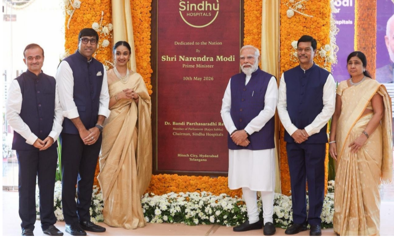
ప్రధాని మోదీ, ఆసుపత్రి బృందాన్ని అభినందించారు. అత్యాధునిక సాంకేతికత

ప్రత్యేక దృష్టి పెట్టడం అభినందనీయమని తెలిపారు. సింధు ఆసుపత్రి ప్రారంభంతో హైదరాబాద్ లో వైద్య సేవలు మరింత విస్తరించే అవకాశం ఉందని వైద్య వర్గాలు అభిప్రాయపడుతున్నాయి. అత్యాధునిక చికిత్సా సౌకర్యాలు, నిపుణుల వైద్య సేవలు అందుబాటులోకి రావడంతో రోగులకు మెరుగైన సేవలు లభించే అవకాశముందని చెబుతున్నారు. ఇటీవల ఆరోగ్య రంగంపై కేంద్ర ప్రభుత్వం ప్రత్యేక దృష్టి సారీస్తున్న నేపథ్యంలో దేశవ్యాప్తంగా వైద్య మౌలిక వసతుల విస్తరణకు ప్రాధాన్యం ఇస్తోంది. ఈ క్రమంలో హైదరాబాద్ లో సింధు ఆసుపత్రి ప్రారంభం ప్రధానమంత్రి సంతోషించుకుంది.