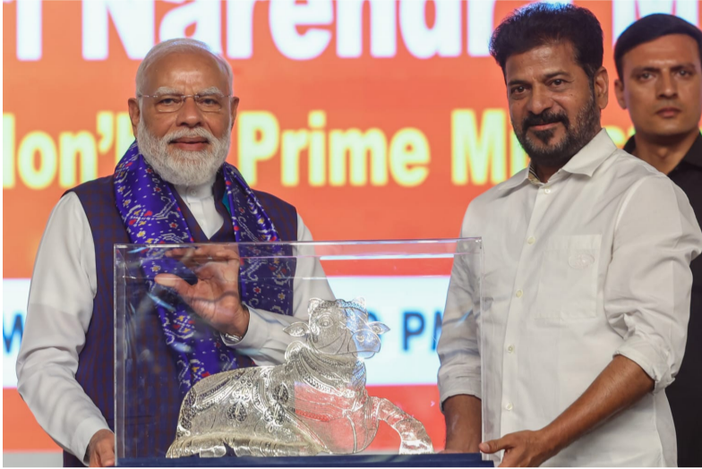
సృష్టం చేశారు. వికసిత భారత్ 2047 ఆర్థిక శక్తిగా ఎదగాలని ప్రధానమంత్రి నిర్దేశించారు. అందులో తెలంగాణనుంచి దేశ

తెలంగాణకు సంబంధించిన రీజినల్ రింగ్ రోడ్, మెట్రో రైలు విస్తరణ, మూసీ నది పునరుద్ధకం, రేడియల్ రోడ్లు, హైదరాబాద్ మచిలీపట్నం 12 వరుసల రహదారి వంటి కీలక ప్రతిపాదనలు కేంద్రం ముందుంచా మని ముఖ్యమంత్రి గుర్తు చేశారు. రాష్ట్ర ప్రయోజనాల కోసం తాను పలుమార్లు ప్రధానమంత్రి, కేంద్ర మంత్రులను కలిశానని, కొన్ని ప్రాజెక్టులకు అత్యవసర ఆమోదాలు అవసరమని పేర్కొన్నారు. రెండు గంటల సమయం కేటాయింది తెలంగాణ ప్రతిపాదనలను సమగ్రంగా పరిశీలించాలని ప్రధానమంత్రిని కోరారు. దేశ అభివృద్ధి విషయంలో తెలంగాణ కేంద్రంతో కలిసి పని చేయడానికి సిద్ధంగా ఉందని ముఖ్యమంత్రి