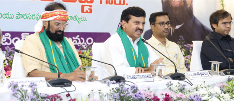
మంత్రి పొంగులేటి శ్రీనివాసరెడ్డితో కలిసి మంత్రులు మాట్లాడుతూ.. ఈ సీజన్ లో రూ. 22 వేల కోట్లతో 85 లక్షల మెట్రిక్ టన్నుల

ఖమ్మం బ్యారో, మే 14(తెలంగాణ ముచ్చట్లు): రైతులు పండించిన ప్రతి ధాన్యం గింజనూ మద్దతు ధరతో ప్రభుత్వమే కొనుగోలు చేస్తుందని రాష్ట్ర పౌర సరఫరాల శాఖ మంత్రి ఉత్తమ్ కుమార్ రెడ్డి స్పష్టం చేశారు. గురువారం పాలేరులో ఏర్పాటు చేసిన ధాన్యం కొనుగోలు కేంద్రాన్ని తెలంగాణ రెవెన్యూ, గృహ నిర్మాణం, సమాచార శాఖల