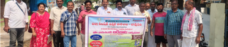
పాఠశాలల్లో అందిస్తున్న సౌకర్యాలు, నాణ్యమైన బోధన గురించి అవగాహన కల్పించారు. ప్రతి చిన్నారి తప్పనిసరిగా విద్యను అభ్యసించాలని, ప్రభుత్వ పాఠశాలల్లో అంగ మాధ్యమ బోధనతో పాటు డిజిటల్ తరగతులు, ఉచిత పాఠ్యపుస్తకాలు, యూనిఫార్ములు, మధ్యాహ్న భోజనం వంటి సదుపాయాలు

ఎల్కత్తుర్తి, మే 14 (తెలంగాణ ముచ్చట్లు): ప్రజా పాలన - ప్రగతి ప్రణాళిక 99 రోజుల కార్యక్రమం, విద్యా వారోత్సవాల్లో భాగంగా ప్రాఫెసర్ జయశంకర్ బడి బాట కార్యక్రమాన్ని ఎల్కత్తుర్తి మండలంలోని ప్రభుత్వ పాఠశాలల ఆధ్వర్యంలో గురువారం ఘనంగా నిర్వహించారు. మండలంలోని బాపుపేట, తిమ్మపూర్, ఎల్కత్తుర్తి, దామెర గ్రామాల్లో ఉపాధ్యాయులు, విద్యార్థులు కలిసి బడి బాట ర్యాలీలు నిర్వహిస్తూ ప్రభుత్వ విద్యా ప్రాముఖ్యతను ప్రజలకు వివరించారు. ఈ సందర్భంగా ఉపాధ్యాయులు గ్రామాల్లో ఇంటింటికీ తిరిగి విద్యార్థుల తల్లిదండ్రులను కలిసి ప్రభుత్వ