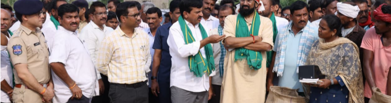
ర్భంగా మంత్రి పొంగులేటి మాట్లాడుతూ.. రైతులకు అందగా ఉండాలనే లక్ష్యంతో మద్దతు ధరకు అదనంగా రూ. 500 బోసన్

ఖమ్మం బ్యారో, మే 14(తెలంగాణ ముచ్చట్లు): రైతులు పండించిన ప్రతి ధాన్యం గింజనూ ప్రభుత్వం మద్దతు ధరతో కొనుగోలు చేస్తుందని తెలంగాణ రెవెన్యూ, గృహ నిర్మాణం, సమాచార శాఖ మంత్రి పొంగులేటి శ్రీనివాస రెడ్డి భరోసా ఇచ్చారు. గురువారం ఖమ్మం బడిబినిలో పౌర సరఫరాల శాఖ మంత్రి ఉత్తమ్ కుమార్ రెడ్డితో కలిసి ఆయన ఉమ్మడి జిల్లా ధాన్యం కొనుగోళ్లపై సమీక్ష నిర్వహించారు. ఈ సంద