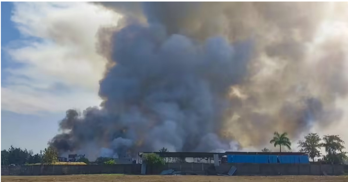
దేవాన్ జిల్లా తొంకాలన్ గ్రామంలో విషాదం భారీ పేలుడు ధాటికి 25 మందికి తీవ్ర గాయాలు సహాయక చర్యలు చేపట్టిన పోలీసులు, రెస్క్యూ టీమ్స్

మధ్యప్రదేశ్ రాష్ట్రంలోని దేవాన్ జిల్లాలో గురువారం ఉదయం పెను విషాదం చోటుచేసుకుంది. తొంకాలన్ గ్రామంలో అక్రమంగా నిర్మిస్తున్న ఒక పటాకుల తయారీ కేంద్రంలో అకస్మాత్తుగా భారీ పేలుళ్లు సంభవించాయి. ఈ ప్రమాదం ధాటికి ఫ్యాక్టరీ ప్రాంగణం ఒక్కసారిగా దర్భరిల్లిపోగా, అక్కడికక్కడే ముగ్గురు వ్యక్తులు ప్రాణాలు కోల్పోయారు. నిబంధనలకు విరుద్ధంగా జనసామర్థ్యం ఉన్న ప్రాంతానికి సమీపంలో ఈ ఫ్యాక్టరీని నడుపుతున్నట్లు ప్రాథమిక సమాచారం అందుతోంది. ఈ భీకర పేలుళ్ల కారణంగా మరో 25 మంది కార్మికులు, స్థానికులు తీవ్రంగా గాయపడ్డారు. ప్రమాదం జరిగిన వెంటనే ఘటనా స్థలంలో హోంకారాలు మిన్నంటాయి. సమాచారం అందుకున్న వెంటనే అగ్నిమాపక సిబ్బంది, స్థానిక పోలీసులు అక్కడికి చేరుకుని మంటలను అదుపు చేసే ప్రయత్నం చేశారు. గాయపడిన వారిలో 13 మందిని చికిత్స నిమిత్తం దేవాన్ జిల్లా ఆసుపత్రికి తరలించగా, మిగిలిన 12 మంది పరిస్థితి విషమంగా ఉండటంతో వారిని మెరుగైన వైద్యం కోసం ఇండోర్లోని పెద్ద ఆసుపత్రికి తరలించారు. స్థానికులు తెలిసిన వివరాల ప్రకారం,