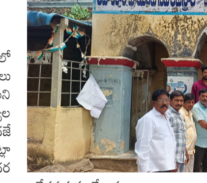
ఆవేదన వ్యక్తం చేశారు. ధాన్యం కొనుగోలు ప్రక్రియలో ఆలస్యం కారణంగా రైతులు రోజుల తరబడి కేంద్రాల వద్దే వేచి ఉండాల్సి వస్తోందని తెలిపారు.

ఎమ్మార్.కె. కార్యాలయంలో బిజినీస్ పట్టణ శాఖ విసతిపత్రం పునరావాహన.మే 20 (తెలంగాణ ముచ్చటలు): హుజూరాబాద్ పట్టణ శాఖ ఆధ్వర్యంలో రైతులు ఎదుర్కొంటున్న ధాన్యం కొనుగోలు సమస్యలను వెంటనే పరిష్కరించాలని కోరుతూ బుధవారం ఎమ్మార్.కె. కార్యాలయంలో అధికారులకు విసతిపత్రం అందజేశారు. ఈ సందర్భంగా నాయకులు మాట్లాడుతూ ప్రభుత్వం ప్రకటించిన మద్దతు ధర రైతులకు పూర్తిస్థాయిలో అందేలా చర్యలు తీసుకోవాలని డిమాండ్ చేశారు. కొనుగోలు కేంద్రాల్లో సరైన సదుపాయాలు లేక రైతులు తీవ్ర ఇబ్బందులు ఎదుర్కొంటున్నారని