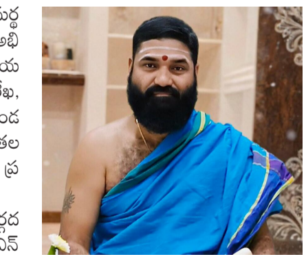
సుమారు 458 మంది డీడీఎస్ అర్చకులు ఉన్నట్లు సమాచారం.