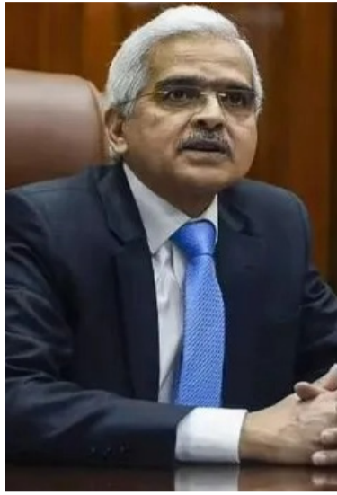
మారకపు రేటును లక్ష్యంగా పెట్టుకోలేదని పేర్కొన్నారు. కరెన్సీ మార్కెట్లో అసాధారణ అస్థిరతలు లేదా అధిక ఊహగానాలు చోటు

దాల్తో పోలిస్తే రూపాయి బలహీనపడుతున్న పరిస్థితులపై రిజర్వ్ బ్యాంక్ ఆఫ్ ఇండియా గవర్నర్ సంజయ్ మల్హోత్రా కీలక వ్యాఖ్యలు చేశారు. ప్రస్తుతం రూపాయి విలువ ఓవర్ వాల్యూ అయిందని చెప్పలేమని, అయితే వాస్తవిక విలువ కంటే తక్కువ స్థాయిలో ప్రేక్షకులందరినీ పేర్కొన్నారు. అంతర్జాతీయ ఉద్రిక్తతలు, ముడి చమురు ధరల పెరుగుదల, ప్రపంచ మార్కెట్లో అనిశ్చిత పరిస్థితులు వంటి కారణాలతో ఇటీవలి కాలంలో రూపాయి విలువ భారీగా పడిపోయిందని తెలిపారు. రూపాయికి ఒక నిర్దిష్ట మారకపు విలువను నిర్ణయించడం కంటే విదేశీ మారక ద్రవ్య మార్కెట్ను స్థిరంగా ఉంచడానికే ఆర్బిఐ ఎక్కువ ప్రాధాన్యం ఇస్తుందని సంజయ్ మల్హోత్రా స్పష్టం చేశారు. రూపాయి విలువకు సంబంధించి ఎలాంటి నిర్దిష్ట