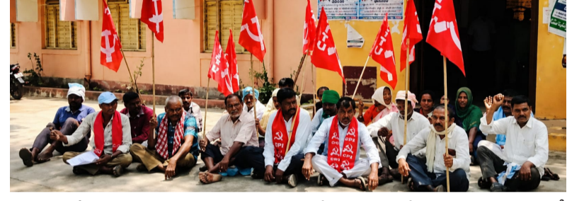
పంచాయతీ కార్యాలయాలకు గత ఏనిమిది సంవత్సరాలుగా వేతనాలు పెంచకపోవడంతో జీవనోపాధి కష్టతరంగా మారిందన్నారు. ప్రస్తుతం రూ.9,500 వేతనంతో కుటుంబాలను పోషించడం భారంగా మారినది

హుజూరాబాద్, జూన్ 1 (తెలంగాణ ముచ్చట్లు): గ్రామ పంచాయతీ కార్యాలయ సమస్యలను ప్రభుత్వం తక్షణమే పరిష్కరించాలని డిమాండ్ చేస్తూ హుజూరాబాద్ లోని ఎంపీడివో కార్యాలయం ఎదుట సీఐటీయూ ఆధ్వర్యంలో గ్రామ పంచాయతీ కార్యాలయ ధర్నా నిర్వహించారు. తెలంగాణ గ్రామ పంచాయతీ ఎంప్లాయిస్ అండ్ వర్కర్స్ యూనియన్ హుజూరాబాద్ మండల కమిటీ ఆధ్వర్యంలో జరిగిన ఈ కార్యక్రమంలో కార్యకులు పెద్ద సంఖ్యలో పాల్గొని తమ డిమాండ్లను వినిపించారు. ఈ సందర్భంగా నాయకులు మాట్లాడుతూ, గ్రామ