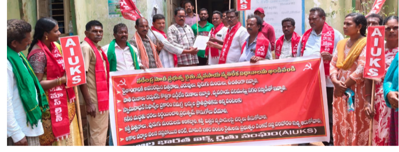
నికీ అవసరమైన వ్యవసాయ పనిముట్లను సగం సబ్సిడీపై ప్రభుత్వం అందించాలని కోరారు. పంటలకు కనీస మద్దతు ధరలు నిర్ణయించి ప్రభుత్వమే కొనుగోలు చేయాలని, కల్తీ విత్తనాలు, పురుగుమందుల విక్రయాలను అరికట్టి బాధ్యులపై కఠిన చర్యలు తీసుకోవాలని డిమాండ్ చేశారు. అకాల వర్షాల వల్ల నష్టపోయిన అరటి, మామిడి తదితర పంటలకు వెంటనే నష్టపరిహారం

చెల్లించి రైతులను ఆదుకోవాలని కోరారు. దేశ ఆర్థిక వ్యవస్థ అభివృద్ధి చెందుతోందని కేంద్ర ప్రభుత్వం చెబుతున్నప్పటికీ పెట్రోల్, డీజిల్ ధరలు నిరంతరం పెరుగుతుండడం ప్రజలపై ఆదనపు భారం మోపుతోందన్నారు. రైతు వ్యతిరేక, కార్పొరేట్ అనుకూల విధానాలను కేంద్ర ప్రభుత్వం ఉపసంహరించుకోవాలని, స్వామినాథన్ కమిషన్ సిఫారసుల ప్రకారం పంటలకు గిట్టుబాటు