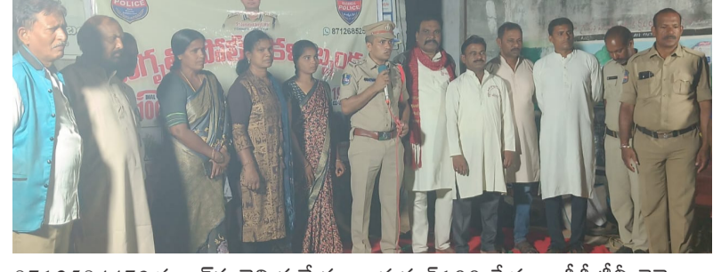
8712584473 నంబర్ కు తెలియజేయాలని ప్రజలకు విజ్ఞప్తి చేశారు. అలాగే విద్య ప్రాధాన్యత, రోడ్డు భద్రత, బాల్య వివాహాల నివారణ, బాల కార్మిక వ్యవస్థ నిర్మూలన,