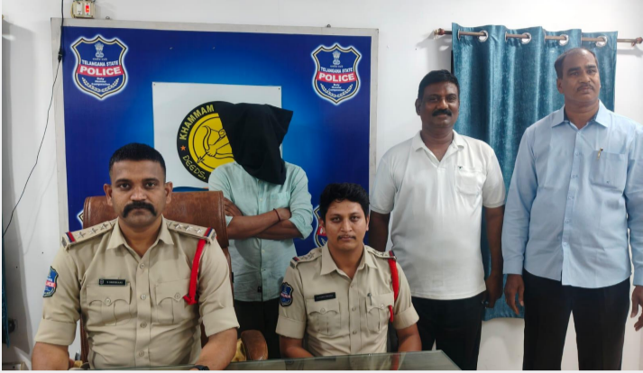
సత్తుపల్లి, జూన్ 4 (తెలంగాణ ముచ్చట్లు):