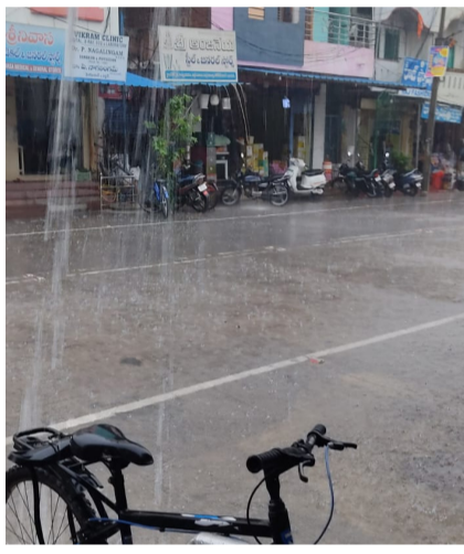
తాయని ఆశాభావం వ్యక్తం చేస్తున్నారు. వాతావరణం చల్లబడటంతో ప్రజలు

పూజారాబాద్, జూన్ 4 (తెలంగాణ ముచ్చట్లు): పూజారాబాద్ పట్టణం మరియు పరిసర ప్రాంతాల్లో గురువారం వాతావరణం ఒక్కసారిగా మారి చిరుజల్లులు కురిశాయి. ఉదయం నుంచి మేఘవృత్తంతో ఆకాశంతో పాటు చల్లని గాలులు వీయడంతో ఎండ తీవ్రత నుంచి ప్రజలకు కొంత ఉపశమనం లభించింది. పలుచోట్ల స్వల్ప వర్షం కురవడంతో రహదారులు తడిసి ముద్దయ్యాయి. ఇటీవల పెరిగిన ఉష్ణోగ్రతల కారణంగా ఇబ్బందులు ఎదుర్కొంటున్న ప్రజలు ఈ వర్షంతో ఊరట పొందారు. రైతులు కూడా వర్షాన్ని స్వాగతిస్తూ, వ్యవసాయ పనులకు అనుకూల పరిస్థితులు ఏర్పడ