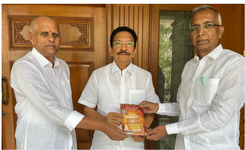
గ్రామ ప్రజల ఆధ్యాత్మిక అవసరాలతో హాల్ నిర్మాణాలు పూర్తయితే గ్రామ ప్రజలకు యోగపడే విధంగా నిర్మిస్తున్న శ్రీ కోదండ రామాలయం, ధన్వంతరి మల్టీపర్పస్ హాల్ ప్రాముఖ్యతను వివరించారు. ఈ నిర్మాణాలు పూర్తయితే గ్రామ ప్రజలకు యోగపడే విధంగా నిర్మిస్తున్న శ్రీ కోదండ రామాలయం, ధన్వంతరి మల్టీపర్పస్ హాల్ ప్రాముఖ్యతను వివరించారు. ఈ నిర్మాణాలు పూర్తయితే గ్రామ ప్రజలకు యోగపడే విధంగా నిర్మిస్తున్న శ్రీ కోదండ రామాలయం, ధన్వంతరి మల్టీపర్పస్ హాల్ ప్రాముఖ్యతను వివరించారు.