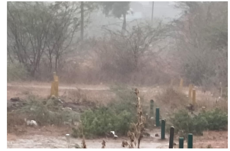
సంతోషం వ్యక్తం చేశారు. పూజారాబాద్ ప్రాంతంలో మరికొన్ని గంటల పాటు

మేఘవృత్త వాతావరణం కొనసాగనున్నట్లు స్థానికులు పేర్కొన్నారు.