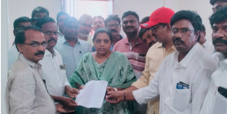
జిల్లా విద్యాశాఖ అధికారులకు టీజేఎఫ్ జర్నలిస్టుల బృందం విసతి