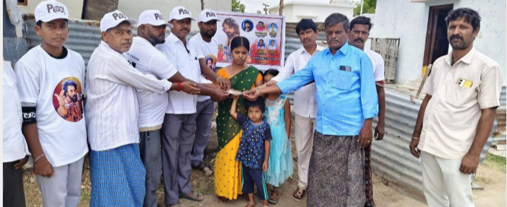
నిరుపేద కుటుంబానికి రూ.10 వేల ఆర్థిక సహాయం