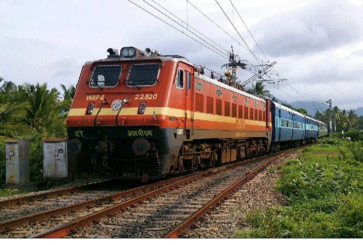
భారత రైల్వేలు రెండు వేల రెండవ సంవత్సరంలో అంతర్జాతీయ ఆధారిత టికెట్ బుకింగ్ సేవలను ప్రారంభించాయి. అప్పటి నుంచి టికెట్ బుకింగ్ వద్ద కంటి అంతర్జాతీయ ద్వారా టికెట్లు బుక్ చేసుకునే వారి సంఖ్య నిరంతరం పెరుగుతోంది. ప్రస్తుతం దేశ వ్యాప్తంగా అమ్ముడవుతున్న మొత్తం రైల్వే టికెట్లలో దాదాపు ఎనిమిది శాతం టికెట్లు డిజిటల్ వేదికల ద్వారానే విక్రయం వుతున్నాయి. ఈ భారీ డిమాండ్ ను దృష్టిలో ఉంచుకొని పాత వ్యవస్థ స్థానంలో కొత్త సాంకేతిక వేదికను ప్రవేశపెడుతున్నారు. రైల్వే శాఖ గత ఏడాది ప్రారంభించిన “రైల్ వేస్” అనువర్తనం కూడా విశేష ఆదరణ అందుతోంది. ఈ అనువర్తనం ద్వారా టికెట్ బుకింగ్, టికెట్ రద్దు, రైలు ప్రయాణ స్థితి, ఫ్లాట్ నెంబర్ వివరాలు, ఫిర్యాదుల నమోదు వంటి అనేక సేవలను ఒకే చోట పొందే అవకాశం ఉంది. ప్రారంభమైన తక్కువ కాలంలోనే కోట్లాది మంది ఈ అను

పరిష్కారం లభించే అవకాశం ఉందని అధికారులు చెబుతున్నారు. ఒకేసారి భారీ సంఖ్యలో వినియోగదారులు సేవలను వినియోగించినప్పటికీ ఎలాంటి అంతరాయాలు లేకుండా పనిచేసే విధంగా దీనిని రూపొందిస్తున్నారు.