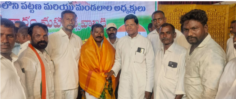
అధ్యక్షులలో నిర్వహించిన బీఎల్ఎం ప్రత్యేక శిక్షణ కార్యక్రమంలో ఆయన ముఖ్య అతిథిగా పాల్గొని మాట్లాడారు. స్వాతంత్ర్యం కోసం కాంగ్రెస్ పార్టీ కీలక పాత్ర