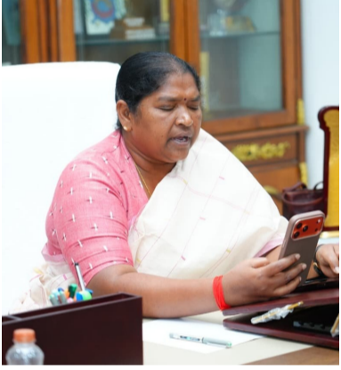
కచ్చితంగా పాటించాలని, ఆహార నాణ్యత విషయంలో ఎలాంటి రాజీ ఉండకూడదని స్పష్టం చేశారు. విద్యార్థుల ఆరోగ్య పరిరక్షణ కోసం క్రమం తప్పకుండా వైద్య పరీక్షలు నిర్వహించాలని కూడా సూచించారు. గురుకులాలు, కస్తూర్బా విద్యాలయాలు,

సమీక్ష సమావేశం నిర్వహించారు. హైదరాబాద్ నుంచి దూరవాణి ద్వారా సమావేశంలో పాల్గొన్న మంత్రి సీతక్క అధికారులకు పలు కీలక సూచనలు చేశారు. పాఠశాలలు ప్రారంభమయ్యే నాటికి అన్ని విద్యాసంస్థల్లో మౌలిక సదుపాయాలు సిద్ధంగా ఉండాలని మంత్రి ఆదేశించారు. తరగతి గదులు, తాగునీటి సౌకర్యాలు, మరుగుదొడ్లు, విద్యుత్ వ్యవస్థ, పరిశుభ్రత వంటి అంశాలపై ప్రత్యేక దృష్టి పెట్టాలని సూచించారు. విద్యార్థులు ఎలాంటి ఇబ్బందులు ఎదుర్కోకుండా ముందస్తు చర్యలు తీసుకోవాలని చెప్పారు. వసతి గృహాల్లో ఉండే విద్యార్థులకు నాణ్యమైన ఆహారం అందించడం అత్యంత ముఖ్యమని మంత్రి పేర్కొన్నారు. పోషకాహార ప్రమాణాలను