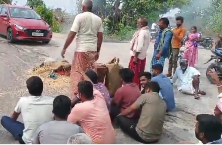
తడిసిన ధాన్యాన్ని కొనుగోలు చేయాలని, రైతులకు న్యాయం చేయాలని అన్నారం గ్రామ రైతులు డిమాండ్ చేశారు. తమ సమస్యలు పరిష్కారం అయ్యే వరకు పోరాటాన్ని కొనసాగిస్తామని హెచ్చరించారు.

కొనుగోలు చేయాలని రైతులు డిమాండ్ చేశారు. ప్రకృతి వైపరీత్యం కారణంగా నష్టపోయిన రైతులను ఆదుకునేందుకు ప్రత్యేక చర్యలు తీసుకోవాలని కోరారు. నష్టపరిహారం ప్రకటించడంతో పాటు వెంటనే కొనుగోలు ప్రక్రియ ప్రారంభించాలని విజ్ఞప్తి చేశారు. నిరసన కారణంగా కొంతసేపు రాకపోకలకు అంతరాయం ఏర్పడింది. సంఘటన స్థలానికి చేరుకున్న అధికారులు రైతులతో మాట్లాడి సమస్యలను తెలుసుకున్నారు. ఉన్నతాధికారుల దృష్టికి సమస్యను తీసుకెళ్లి పరిష్కారానికి చర్యలు తీసుకుంటామని హామీ ఇచ్చినట్లు సమాచారం. ప్రభుత్వం వెంటనే స్పందించి