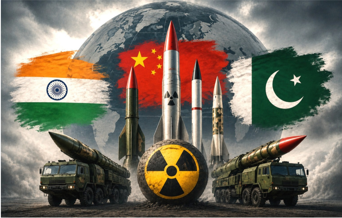
వద్ద సుమారు 620 అణు వాల్ హెడ్లు ఉన్న మాత్రమే ఉండగా, ఏడాది వ్యవధిలోనే మరో 600 డి.వి.సి. భారత్ తన వైమానిక దళ యుద్ధ

ప్రపంచవ్యాప్తంగా అణ్వాయుధ పోటీ మరింత వేగం పుంజుకుంటున్నట్లు జాతీయ అంతర్జాతీయ శాంతి పరిశోధనా సంస్థ నివేదిక వెల్లడించింది. ముఖ్యంగా భారత్, పాకిస్తాన్ దేశాలు కొత్త తరహా అణ్వాయుధ రవాణా వ్యవస్థలను అభివృద్ధి చేస్తున్నాయని నివేదిక పేర్కొంది. అదే సమయంలో బాలిస్టిక్ క్షిపణులకు అణు వాల్ హెడ్లను అమర్చే సామర్థ్యాన్ని కూడా ఈ రెండు దేశాలు మెరుగుపరుచుకున్నట్లు వెల్లడించింది. ప్రపంచ భద్రతా పరిస్థితుల నేపథ్యంలో ఈ పరిణామాలు అంతర్జాతీయ స్థాయిలో చర్చనీయాంశంగా మారాయి. నివేదిక ప్రకారం జనవరి 2026 నాటికి భారత్ వద్ద సుమారు 190 అణ్వాయుధాలు ఉన్నట్లు అంచనా వేస్తున్నారు. గత ఏడాదితో పోలిస్తే ఈ సంఖ్య స్వల్పంగా పెరిగినట్లు పేర్కొన్నారు. మరోవైపు చైనా అణ్వాయుధ నిల్వలను మరింత వేగంగా విస్తరించుకుంటోంది. ప్రస్తుతం ఆ దేశం