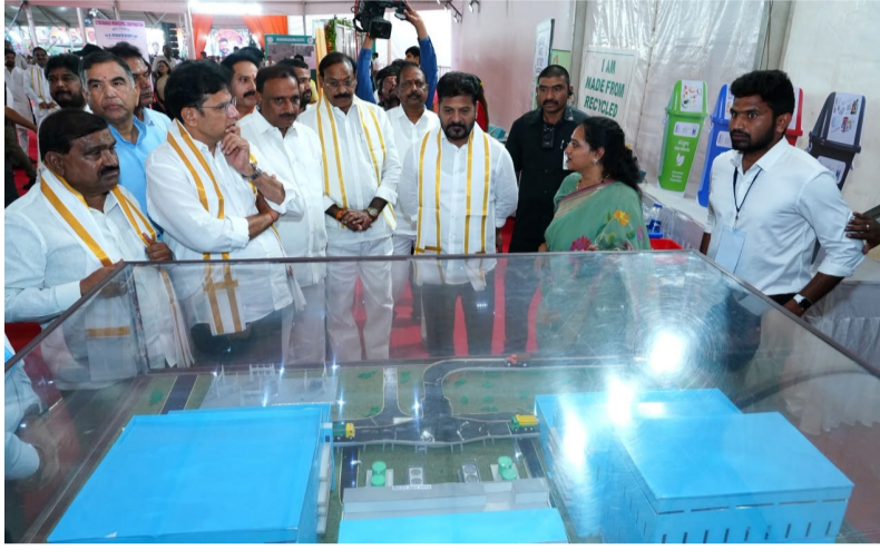
వికేంద్రీకరణ అవసరమైందని ముఖ్యమంత్రి పేర్కొన్నారు. అందుకే మహానగర ప్రాంతాన్ని మూడు కార్పొరేషన్లుగా విభజించి గ్రేటర్ హైదరాబాద్, సైబరాబాద్, మల్కాజిగిరి మునిసిపల్ కార్పొరేషన్లుగా ఏర్పాటు చేశామని తెలిపారు. అభివృద్ధి విషయంలో రాజకీయ భేదాలు పక్కనపెట్టి అన్ని వర్గాలు సహకరించాలని ముఖ్యమంత్రి దీవేంద్రే రెడ్డి పిలుపునిచ్చారు.

హైదరాబాద్ మహానగరంలో మెట్రో విస్తరణ, మూసీ నది ప్రక్షాళన, ప్రాంతీయ వలయ రహదారి, అనుసంధాన రహదారుల నిర్మాణం వంటి కీలక మౌలిక సదుపాయాల అభివృద్ధికి ప్రభుత్వం ప్రాధాన్యం ఇస్తోందని పేర్కొన్నారు. విశ్వనగరంగా ఎదగాలంటే దానికి తగిన మౌలిక వసతులు కల్పించడం అత్యవసరమని అన్నారు. నగరంలో పేదల గృహ అవసరాలను తీర్చేందుకు లక్ష తక్కువ ఆదాయ, మధ్యతరగతి గృహాల నిర్మాణానికి ప్రభుత్వం ప్రణాళిక రూపొందిస్తున్నట్లు తెలిపారు. ప్రజలు నివసిస్తున్న ప్రాంతాల్లోనే గృహాలు నిర్మించి కేటాయించే విధంగా చర్యలు తీసుకుంటున్నామని, అందుకు అవసరమైన ప్రభుత్వ భూములను గుర్తిస్తున్నామని చెప్పారు. హైదరాబాద్ వేగంగా విస్తరిస్తున్న నేపథ్యంలో పరిపాలనా వికేంద్రీకరణ అవసరమైందని ముఖ్యమంత్రి పేర్కొన్నారు. అందుకే మహానగర ప్రాంతాన్ని మూడు కార్పొరేషన్లుగా విభజించి గ్రేటర్ హైదరాబాద్, సైబరాబాద్, మల్కాజిగిరి మునిసిపల్ కార్పొరేషన్లుగా ఏర్పాటు చేశామని తెలిపారు. అభివృద్ధి విషయంలో రాజకీయ భేదాలు పక్కనపెట్టి అన్ని వర్గాలు సహకరించాలని ముఖ్యమంత్రి దీవేంద్రే రెడ్డి పిలుపునిచ్చారు.