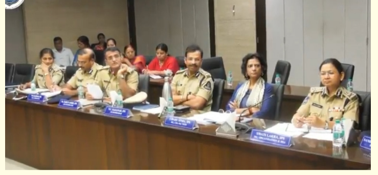
పోలీసు సంఘాల ఎన్నికలు, సిబ్బంది, వాహనాల తనిఖీలు, సంక్షేమ నిధుల లెక్కల పరిశీలన, నాలుగు పోలీసు కమిషనరీలు పునర్వ్యవస్థీకరణ వంటి అంశాలపై కూడా సమీక్ష నిర్వహించారు. శాఖలో సమర్థవంతమైన పరిపాలన, సమన్వయం కోసం ఇటువంటి సమావేశాలు నిరంతరం కొనసాగుతాయని అధికారులు తెలిపారు.

సాంకేతిక పరిజ్ఞానం ఆధారిత పోలీసింగ్ కు మరింత ప్రాధాన్యం ఇవ్వాలని సమావేశంలో నిర్ణయించారు. కృత్రిమ మేధస్సు, డ్రోన్లు, సమాచార విశ్లేషణ వ్యవస్థల వినియోగాన్ని విస్తరించి నేరాల నియంత్రణ, దర్యాప్తు సామర్థ్యాన్ని పెంచే అంశాలపై చర్చించారు. ఆధునిక సాంకేతికత ద్వారా పోలీసు సేవలను మరింత సమర్థవంతంగా అందించే దిశగా చర్యలు చేపట్టాలని నిర్ణయించారు. త్వరలో ఏర్పాటు కానున్న ట్రాఫిక్ నిర్వహణ, రోడ్డు భద్రత విభాగానికి సంబంధించిన పరిపాలనా నిర్మాణం పైన సమావేశంలో చర్చించారు. కొత్త విభాగాల ఏర్పాటుతో ట్రాఫిక్ నియంత్రణ, రహదారి భద్రత చర్యలను మరింత బలోపేతం చేయాలని అధికారులు అభిప్రాయపడ్డారు. మహిళా పోలీసు సిబ్బంది సంక్షేమం, సేవా పరిస్థితుల మెరుగుదలపై కూడా సమావేశంలో ప్రత్యేకంగా చర్చించారు. మహిళా సదస్సులో వచ్చిన సిఫార్సులను అమలు చేసి, మహిళా పోలీసులకు మెరుగైన అవకాశాలు, సౌకర్యాలు కల్పించేందుకు చర్యలు తీసుకోవాలని ని.వి. ఆనంద్ సూచించారు. అదేవిధం