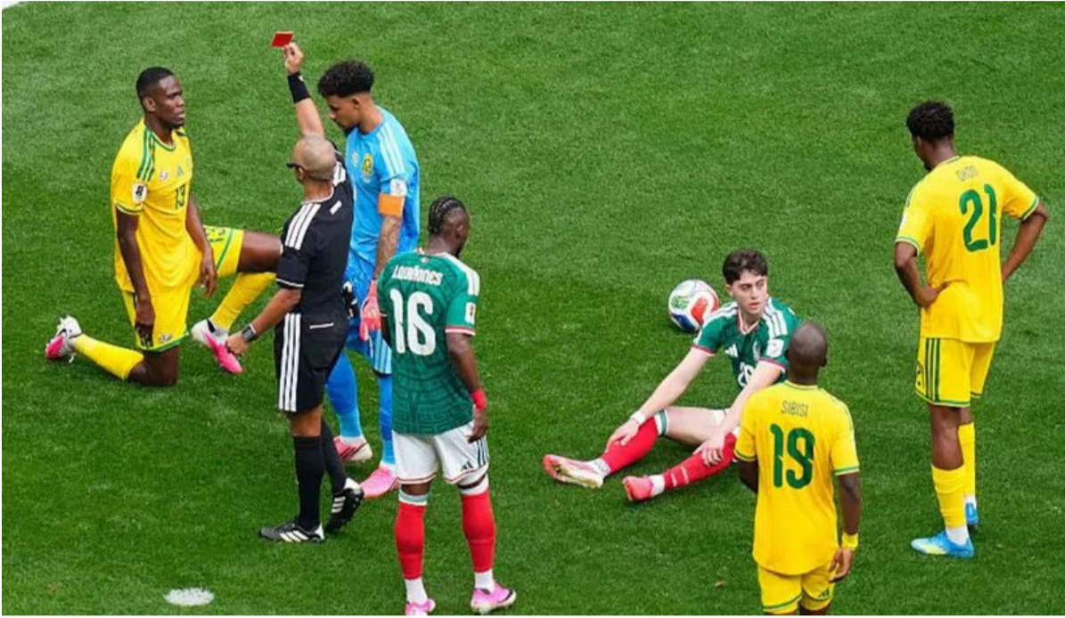
జట్టు మ్యాచ్ కొనసాగించాల్సి వచ్చింది. గతంలో ఖతార్ లో జరిగిన 2022 ప్రపంచ కప్ మొత్తం టోర్నీలో కేవలం నలుగురు ఆటగాళ్లకే ఎర్ర కార్డులు జారీ చేయగా, ఈసారి టోర్నీ తొలి మ్యాచ్ లోనే ముగ్గురు ఆటగాళ్లకు ఎర్ర కార్డులు ఇవ్వడం విశేషంగా మారింది. మెక్సికో మూడోసారి ప్రపంచకప్ కు ఆతిథ్యం ఇస్తోంది. గతంలో 1970, 1986 సంవత్సరాల్లో కూడా ఈ దేశమే టోర్నీని నిర్వహించింది. ఈసారి కూడా మెక్సికో టోర్నీ తొలి మ్యాచ్ లోనే ముగ్గురు ఆటగాళ్లకు ఎర్ర కార్డులు ఇవ్వడం విశేషంగా మారింది. మెక్సికో మూడోసారి ప్రపంచకప్ కు ఆతిథ్యం ఇస్తోంది. గతంలో 1970, 1986 సంవత్సరాల్లో కూడా ఈ దేశమే టోర్నీని నిర్వహించింది. ఈసారి కూడా మెక్సికో టోర్నీ తొలి మ్యాచ్ లోనే ముగ్గురు ఆటగాళ్లకు ఎర్ర కార్డులు ఇవ్వడం విశేషంగా మారింది.