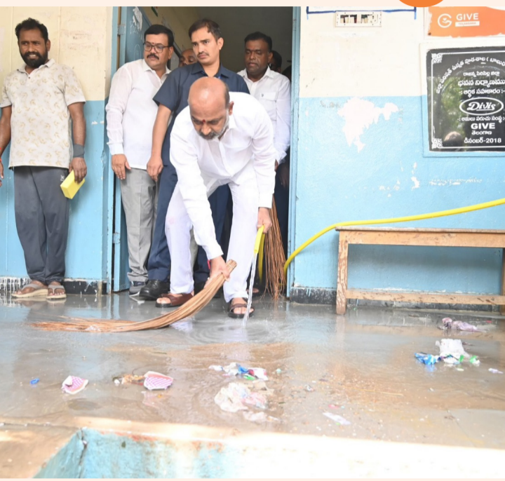
కరీంనగర్, జూన్ 13 (తెలంగాణ ముచ్చాట్లు):

మన బడి మన బాధ్యత సేవలో బీజేపీ కార్యకర్తలు విద్యార్థులకు స్వచ్ఛ వాతావరణం కేంద్ర మంత్రి బండి నంజయ్