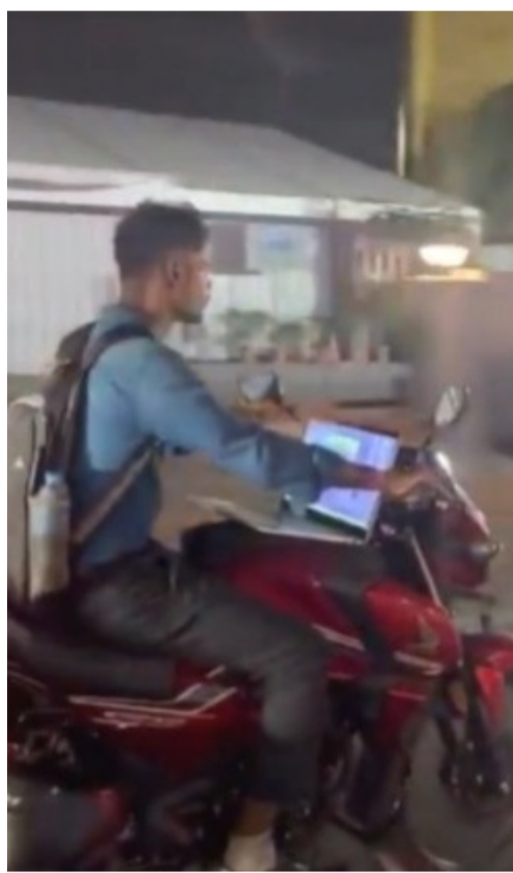
హైదరాబాద్, జూన్ 13 (తెలంగాణ ముచ్చాట్లు):

వర్క్ ఫ్రమ్ బైక్పై ఆందోళన రోడ్డు భద్రతపై సజ్జనార్ సూచనలు నిర్లక్ష్యం ప్రాణాంతకమని హెచ్చరిక