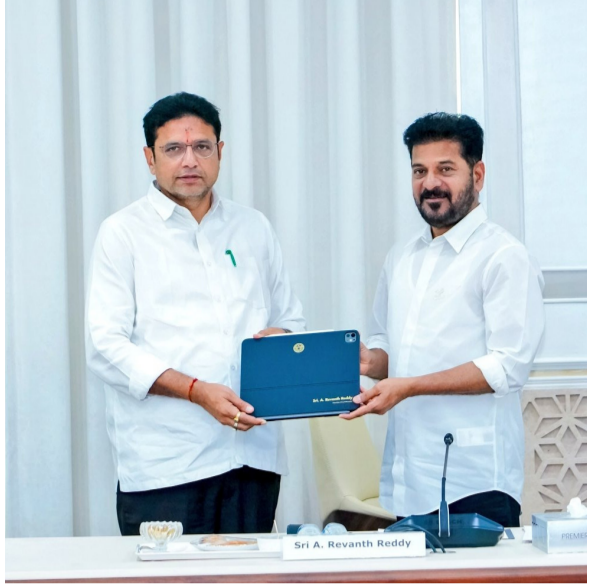
పర్యావరణ పరిరక్షణకు కూడా ఈ నిర్ణయం దోహదపడనుంది. పేపర్ లెస్ గవర్నెన్స్ లక్ష్యంతో తెలంగాణ ప్రభుత్వం చేపడుతున్న

ఈ ట్యాబ్లెట్ ద్వారా మంత్రులు సమావేశాలకు సంబంధించిన అన్ని వివరాలను సులభంగా పరిశీలించవచ్చు. అధునిక సాంకేతికత వినియోగంతో నిర్ణయాల ప్రక్రియ మరింత వేగవంతం కానుందని అధికారులు తెలిపారు. డిజిటల్ క్యాబినెట్ అమలు విధానాన్ని ముఖ్యమంత్రి రేవంత్ రెడ్డి స్వయంగా పరిశీలించారు. ట్యాబ్లెట్ అందుబాటులో ఉన్న సమాచారం, ఎజెండా ప్రదర్శన, డిజిటల్ నిర్వహణ విధానంపై ఆయన అధికారులతో చర్చించారు. వ్యవస్థ సమర్థవంతంగా పనిచేసేలా అవసరమైన సూచనలు చేశారు. ఈజుక్ విధానం ద్వారా మంత్రులకు క్యాబినెట్ సమావేశాలకు సంబంధించిన అన్ని అంశాలు అందుబాటులోకి రానున్నాయి. దీంతో సమాచార మార్పిడి సులభతరం కావడంతో పాటు సమయం, వ్యయం కూడా ఆదా అవుతుందని ప్రభుత్వం భావిస్తోంది.