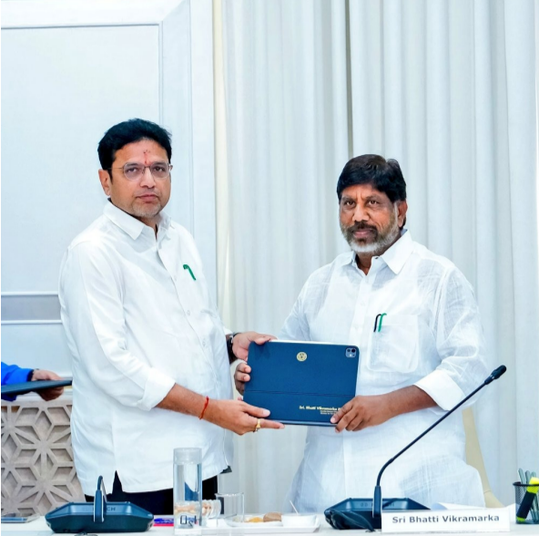
సంస్కరణల్లో డిజిటల్ క్యాబినెట్ ఒక ముఖ్యమైన ముందడుగుగా అధికారులు పేర్కొన్నారు. సాంకేతిక పరిజ్ఞానాన్ని పరిపాలనలో