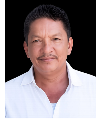
అరికట్టేందుకు ప్రభుత్వం మరింత కఠిన చర్యలు చేపట్టాలని డిమాండ్ చేశారు. ఈ ఘ

తుకానికి పాల్పడిన నిందితుడిపై అత్యంత కఠిన చట్టపరమైన చర్యలు తీసుకుని, ప్రత్యేక న్యాయస్థానం ద్వారా వేగవంతంగా విచారణ పూర్తి చేసి బాధిత కుటుంబానికి త్వరితగతిన న్యాయం అందించాలని కోరారు. నేరస్థులకు కఠిన శిక్షలు అమలు చేసినప్పుడే ఇటువంటి ఘటనలకు అడ్డుకట్ట పడుతుందని వారు స్పష్టం చేశారు. మహిళలు, చిన్నారుల రక్షణ విషయంలో ఎలాంటి నిర్లక్ష్యానికి తావు లేకుండా ప్రభుత్వం, అధికార యంత్రాంగం పనిచేయాలని విజ్ఞప్తి చేశారు. బాధిత బాలికకు, ఆమె కుటుంబ సభ్యులకు ప్రగాఢ సానుభూతి తెలియజిస్తూ, ఈ క్షిప్ర సమయంలో వారికి సమాజం అండగా నిలవాలని పిలుపునిచ్చారు.