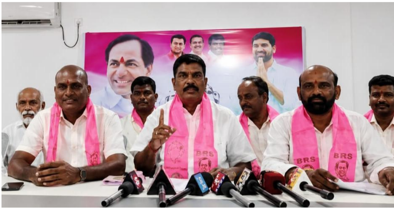
రైతులకు ఇచ్చిన హామీలను అమలు చేయడంలో కాంగ్రెస్ ప్రభుత్వం పూర్తిగా విఫలమైందని ఆరోపించారు. రైతులకు