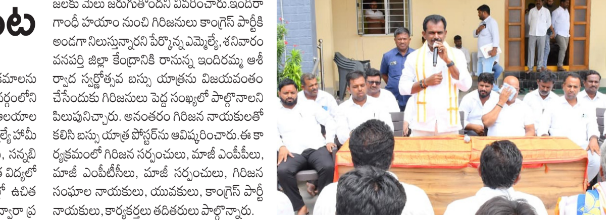
జలకు మేలు జరుగుతోందని వివరించారు. ఇందిరా గాంధీ హయాం నుంచి గిరిజనులు కాంగ్రెస్ పార్టీకి అండగా నిలుస్తున్నారని పేర్కొన్న ఎమ్మెల్యే, శనివారం వనపర్తి జిల్లా కేంద్రానికి రానున్న ఇందిరమ్మ ఆశీర్వాద స్వర్ణోత్సవ బస్సు యాత్రను విజయవంతం చేసేందుకు గిరిజనులు పెద్ద సంఖ్యలో పాల్గొనాలని పిలుపునిచ్చారు. అనంతరం గిరిజన నాయకులతో కలిసి బస్సు యాత్ర పోస్టర్ ను ఆవిష్కరించారు. ఈ కార్యక్రమంలో గిరిజన సర్పంచులు, మాజీ ఎంపీపీలు, మాజీ ఎంపీటీసీలు, మాజీ సర్పంచులు, గిరిజన సంఘాల నాయకులు, యువకులు, కాంగ్రెస్ పార్టీ నాయకులు, కార్యకర్తలు తదితరులు పాల్గొన్నారు.

త్యేక ప్రాధాన్యం ఇస్తూ పలు సంక్షేమ కార్యక్రమాలను అమలు చేస్తోందన్నారు. వనపర్తి నియోజకవర్గంలోని ప్రతి గిరిజన ఆవాస ప్రాంతంలో సేవాలాల్ అలయాల నిర్మాణానికి చర్యలు తీసుకుంటామని ఎమ్మెల్యే హామీ ఇచ్చారు. ఇందిరమ్మ ఇళ్లు, రేషన్ కార్డులు, సస్యల్లియ్యం, ఉచిత విద్యుత్, విద్యార్థులకు ఉన్నత విద్యలో ప్రోత్సాహం, మహిళలకు ఆర్డీసీ బస్సుల్లో ఉచిత ప్రయాణం, రైతు భరోసా వంటి పథకాల ద్వారా ప్ర