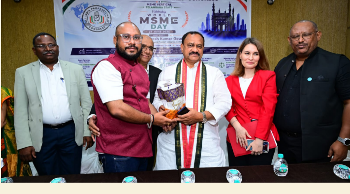
... (Caption text partially obscured)