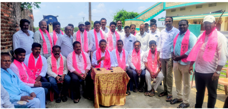
కేసీఆర్ పాలనలో రైతులకు భరోసా

వరంగల్ రైతు డిక్షనరీ అమలుకాదా? రాహుల్ గాంధీ సమక్షంలో ప్రకటించిన వరంగల్ రైతు డిక్షనరీలోని హామీలో ఏ ఒక్కటి కూడా పూర్తిస్థాయిలో అమలు కాలేదని విమర్శించారు. ఎకరానికి రూ.15 వేల రైతు భరోసా, కౌలు రైతులకు సాయం,