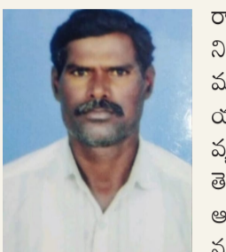
అంకుశాపూర్ లో దారుణ హత్య

కరీంనగర్ జిల్లా జమ్మికుంట మండలం అంకుశాపూర్ గ్రామానికి చెందిన ఓ వ్యక్తి పీల్ల పండుగకు వెళ్లి తిరిగి వస్తుండగా గుర్తుతెలియని దుండగుల చేతిలో దారుణ హత్యకు గురైన ఘటన స్థానికంగా తీవ్ర కలకలం రేపింది. పాత కక్షల నేపథ్యంలో ఈ హత్య జరిగినట్లు పోలీసులు అనుమానిస్తున్నారు.