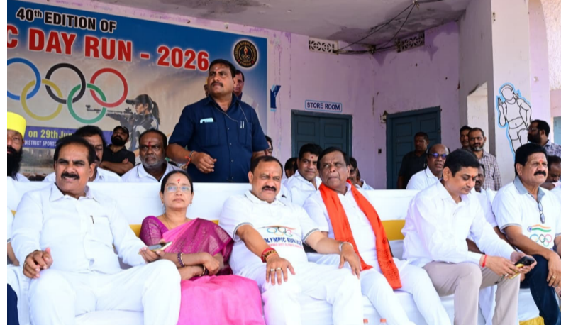
బలోపేతం చేసి యువతను ఆరోగ్యవంతం చేయాలని మహాత్మా కుమార్ గాంధీ మైన సమాజ నిర్వాహంలో భాగస్వామ్యం

అవసరమైన ప్రోత్సాహం అందించాల్సిన అవసరం ఉందన్నారు. యువత ఆరోగ్య వంతమైన జీవనశైలిని అలవర్చుకోవాలని సూచించారు. ఒలింపిక్ డే రన్ ద్వారా ప్రజల్లో ఆరోగ్యంపై అవగాహన పెంపొందించడంతో పాటు క్రీడల పట్ల ఆసక్తిని పెంచే ప్రయత్నం జరుగుతోందని నిర్వాహకులు తెలిపారు. పెద్ద సంఖ్యలో క్రీడాకారులు, విద్యార్థులు, యువత ఈ కార్యక్రమంలో పాల్గొని విజయవంతం చేశారు. ఈ కార్యక్రమంలో జిల్లా ఒలింపిక్ సంఘం ప్రతినిధులు, క్రీడా సంఘాల నాయకులు, ప్రజాప్రతినిధులు, విద్యార్థులు, యువజన సంఘాల సభ్యులు పాల్గొన్నారు. క్రీడా సంస్కృతిని మరింత