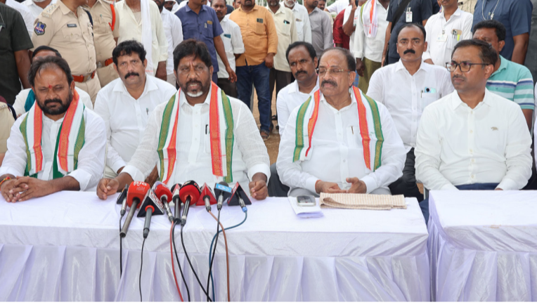
డిప్యూటీ సీఎం భట్టి విక్రమార్క మల్లు

సమక్షంలో సభ నిర్వహించడం సాధ్యం కాదని తెలిపారు. రైతు సంక్షేమానికి అత్యంత ప్రాధాన్యత ఇస్తున్న ఇందిరమ్మ ప్రజా ప్రభుత్వం రైతుల సౌకర్యాన్ని దృష్టిలో పెట్టుకొని సభను వాయిదా వేస్తోందని పేర్కొన్నారు. తొలుత ప్రారంభోత్సవ సభగా నిర్వహించాలని భావించిన ఈ కార్యక్రమాన్ని, ఇప్పుడు రైతు భరోసా పంపిణీ పూర్తయిన అనంతరం మరింత వైభవంగా రైతు ఆశీర్వాద సభ పేరుతో ముగింపు వేడుకగా నిర్వహిస్తామని డిప్యూటీ సీఎం స్పష్టం చేశారు. వాతావరణ శాఖ నివేదికల ప్రకారం జిల్లాలో జూలై 3 లేదా 4వ తేదీ వరకు వర్షాలు కొనసాగే అవకాశం ఉందని తెలిపారు. రైతులకు ఎలాంటి ఆసౌకర్యం కలగకుండా మరో వారం రోజుల వాతావరణ పరిస్థితులను సమీక్షించి, పరిస్థితులు అనుకూలమై వేడుకగా నిర్వహిస్తామని డిప్యూటీ సీఎం స్పష్టం చేశారు. ఈ భారీ బహిరంగ సభను విజయవంతం చేసేందుకు స్థానిక మంత్రులు, ప్రజాప్రతినిధులు, జిల్లా అధికార యంత్రాంగం సమన్వయంతో ఏర్పాటు కొనసాగిస్తున్నట్లు తెలిపారు. ఉమ్మడి ఖమ్మం జిల్లా వ్యాప్తంగా రైతులు, ప్రజలు ఈ సభపై విశేష వూర్తిగా బురదమయంగా మారినందుకు, ప్రస్తుత పరిస్థితుల్లో లక్షలాది మంది రైతుల