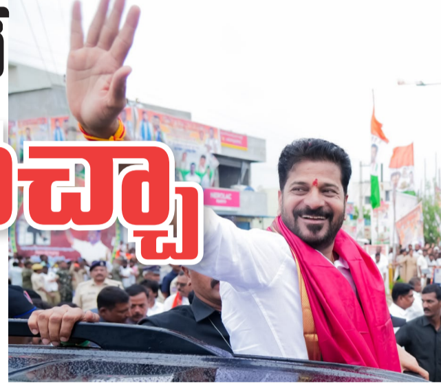
మహబూబ్ నగర్, జూలై 4 (తెలంగాణ ముచ్చాట్లు):

మిడ్జిల్ అభివృద్ధికి కొత్త దిశ.. సీఎం హామీ 20 ఏళ్ల రాజకీయ ప్రస్థాన సభ అభివృద్ధి పనులకు శ్రీకారం వెనుకబడిన మిడ్జిల్ను వెలుగుల మండలంగా మారుస్తాం