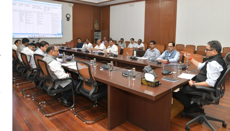
అందేలా పనుల్లో జాప్యానికి తావులేకుండా చర్యలు తీసుకోవాలని సూచించారు. ప్రతి ప్రాజెక్టు పురోగతిని నిరంతరం పర్యవేక్షిస్తూ, అమలులో ఎదురయ్యే అడ్డంకులను వెంటనే తొలగించాలని అధికారులకు ఆదేశించారు. ప్రభుత్వ లక్ష్యాలకు అనుగుణంగా పనులను వేగంగా పూర్తి చేయాలని స్పష్టం చేశారు. ప్రగతి ప్రాజెక్టుల విజయవంతమైన అమలు రాష్ట్ర అభివృద్ధికి కీలకమని పేర్కొన్న ప్రధాన

తెలంగాణ ప్రభుత్వ ప్రధాన కార్యదర్శి కె. రామకృష్ణారావు సోమవారం సచివాలయంలో ప్రగతి (సీఎంజీ) ప్రాజెక్టులపై ఉన్నతస్థాయి సమీక్ష నిర్వహించారు. రాష్ట్రంలో అమలువుతున్న కీలక ప్రాజెక్టుల పురోగతిని పరిశీలిస్తూ వాటి అమలును వేగవంతం చేయాలని అధికారులను ఆదేశించారు. సమీక్ష సమావేశంలో వివిధ శాఖలకు సంబంధించిన ప్రధాన ప్రాజెక్టుల ప్రస్తుత పరిస్థితి, అమలులో ఎదురవుతున్న సమస్యలు, వాటి పరిష్కార మార్గాలపై అధికారులు వివరించారు. ప్రాజెక్టులు నిర్ణీత గడువులో పూర్తయ్యేలా కార్యాచరణ చేపట్టాలని ప్రధాన కార్యదర్శి సూచించారు. అభివృద్ధి కార్యక్రమాల అమలులో శాఖల మధ్య సమన్వయం మరింత పెంచాలని, పెండింగ్ అంశాలను త్వరితగతిన పరిష్కరించాలని అధికారులకు దిశానిర్దేశం చేశారు. ప్రజలకు త్వరగా ప్రయోజనాలు