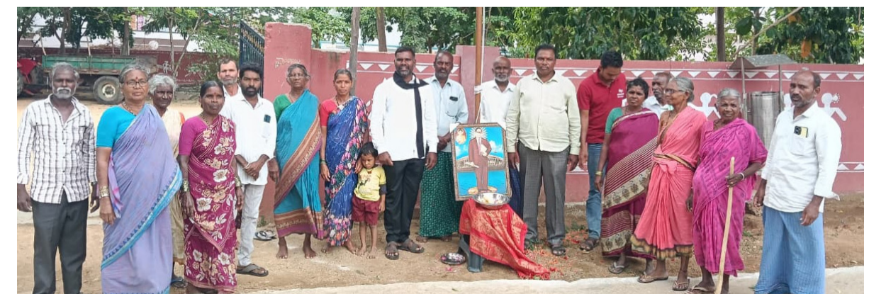
సంక్షేమం, రేషన్ బియ్యం పెంపు, ఫాస్టెటాక్ కోర్సులు వంటి అనేక ప్రజా సమస్యలపై పోరాటాలు నిర్వహించిందని పేర్కొన్నారు. ఎస్సీ రిజర్వేషన్ల వర్గీకరణ కోసం మందకృష్ణ మాదిగ నాయకత్వంలో సాగిన సుదీర్ఘ ఉద్యమ ఫలితంగానే తెలంగాణలో వర్గీకరణ చట్టం అమలులోకి వచ్చి మాదిగలకు 9 శాతం రిజర్వేషన్లు దక్కాయని తెలిపారు. విద్యార్థులు, నిరుద్యోగులు ఈ అవకాశాలను సద్వినియోగం చేసుకుని అన్ని రంగాల్లో