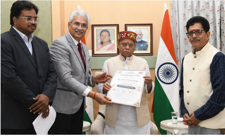
రంగంలో ఆధునిక సాంకేతిక పరిజ్ఞాన వినియోగంపై తమ అభిప్రాయాలను వెల్లడించారు. టెలిమెడిసిన్ సేవల ద్వారా గ్రామీణ, మారుమూల ప్రాంతాల ప్రజలకు నిపుణులైన వైద్యుల సేవలను చేరువ చేయవచ్చని ప్రతినిధులు తెలిపారు. డిజిటల్ సాంకేతికతతో వైద్య సేవలను మరింత విస్తరించే దిశగా చేపడుతున్న కార్యక్రమాలను వివరించారు.