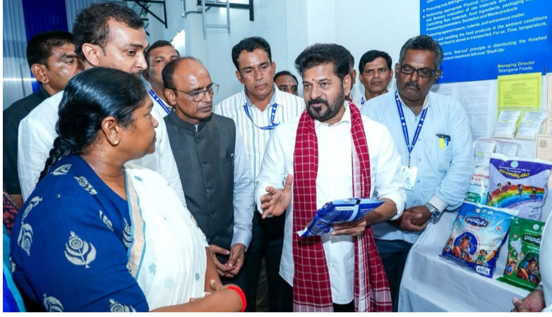
కు ఏమాత్రం తీసిపోని విద్య అందించడమే ప్రభుత్వ లక్ష్యమన్నారు. మహిళా సంఘాలకు రుణాలు, సౌర విద్యుత్ కేంద్రాలు, మహిళా శక్తి కేంద్రాల ఏర్పాటు,

ఇలాంటి పరిశ్రమలు మరిన్ని రావాలని, ప్రభుత్వం అవసరమైన అన్ని విధాల సహకారం అందిస్తుందని హామీ ఇచ్చారు. విద్యారంగంలో కూడా ప్రభుత్వం విభిన్నమైన మార్పులు తీసుకొస్తోందని ముఖ్యమంత్రి తెలిపారు. ప్రభుత్వ పాఠశాలల్లో నర్సరీ నుంచి ఇంటర్మీడియట్ వరకు విద్యార్థులకు అల్పాహారం, మధ్యాహ్న భోజనం, సాయంత్రం అల్పాహారం అందించే కార్యక్రమాన్ని అమలు చేస్తున్నామని చెప్పారు. ప్రతి విద్యార్థి విద్యారంగానికి భారీగా నిధులు వెచ్చిస్తున్నామని, దానిని ఖర్చుగా కాకుండా రాష్ట్ర భవిష్యత్తుపై పెట్టుబడిగా భావిస్తున్నామని పేర్కొన్నారు. పెదల పిల్లలకు కూడా ప్రైవేటు పాఠశాలల