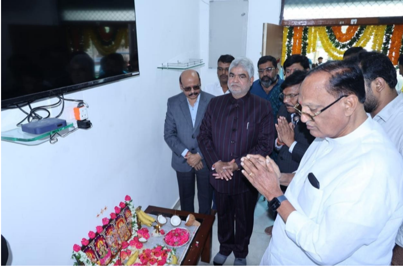
కార్యాలయాలను కూడా ప్రారంభించి వారికి అభినందనలు తెలిపారు. అదే సందర్భంగా అసెంబ్లీ మీడియా అడ్వైజరీ కమిటీ నూతన కార్యాలయాన్ని కూడా ప్రారంభించారు. శాసనసభ కార్యకలాపాల సమాచారాన్ని ప్రజలకు సమర్థవంతంగా చేరవేయడంలో మీడియా విభాగం కీలక పాత్ర పోషిస్తుందని శాసనసభలో ప్రజాప్రతినిధులకు మెరుగైన వసతులు కల్పించేందుకు ప్రభుత్వం