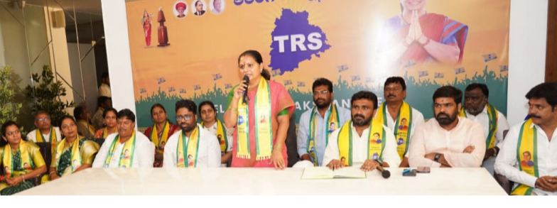
జయశంకర్ సూచించిన సామాజిక న్యాయ తెలంగాణ లక్ష్య సాధన దిశగా బీసీలకు 50 శాతం రిజర్వేషన్ల కోసం ఉద్యమాన్ని మరింత బలోపేతం చేస్తామని చెప్పారు. బీసీలతో పాటు సమాజంలోని అన్ని వర్గాలను ఒక్కతాటిపైకి తీసుకువచ్చి కేంద్ర, రాష్ట్ర ప్రభుత్వాలపై ఒత్తిడి తీసుకొస్తామని పేర్కొన్నారు. జనాభా దామాషా ప్రకారం బీసీలకు రిజర్వేషన్లు కల్పించాలని డిమాండ్‌తో తెలంగాణ

బీసీలకు 50 శాతం రిజర్వేషన్ల సాధన కోసం ఆగస్టు 6న హైదరాబాద్‌లో భారీ బహిరంగ సభ నిర్వహించనున్నట్లు తెలంగాణ రక్షణ సేన అధ్యక్షురాలు కల్యాణం కవిత ప్రకటించారు. సోమవారం బంజారాహిల్స్‌లోని పార్టీ కార్యాలయంలో నిర్వహించిన బీసీ నాయకుల సమావేశంలో ఆమె ఈ విషయాన్ని వెల్లడించారు. ప్రాఫెసర్ జయశంకర్ జయంతి సందర్భంగా "సామాజిక న్యాయ తెలంగాణ సాధన సభ" పేరుతో ఈ కార్యక్రమాన్ని నిర్వహిస్తామని తెలిపారు. ఈ సందర్భంగా కవిత మాట్లాడుతూ, ప్రాఫెసర్