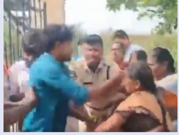
ఆందోళన సమయంలో కొందరు కార్మికులు పెట్రోల్ బోనుకుని ఆత్మహత్యాయత్నానికి యత్నించగా, అక్కడే ఉన్న సహచరులు, అధికారులు అప్రమత్తమై వారిని అడ్డుకున్నారు. దీంతో పెట్రోల్ బోనుకుని ఆత్మహత్యాయత్నానికి పాల్పడటంతో అక్కడ ఉద్రిక్తత నెలకొంది. ఆందోళన చేస్తున్న కార్మికులు మాట్లాడుతూ తమను శాశ్వత ఉద్యోగులుగా చేస్తామని హామీ ఇచ్చి ఎన్నో సంవత్సరాలుగా తక్కువ వేతనాలతో పనిచేయించుకున్నారని ఆరోపించారు. కఠిన పరిస్థితుల్లో విధులు నిర్వహించి నష్టపోయిన ఎలాంటి ముందస్తు సమాచారం లేకుండా ఉద్యోగాలనుంచి తొలగించడం అన్యాయమని ఆవేదన వ్యక్తం చేశారు.

సూర్యాపేట జిల్లా చింతలపాలెం మండలంలోని పులిచింతల విద్యుత్ ఉత్పత్తి కేంద్రం వద్ద సోమవారం ఉద్రిక్త పరిస్థితులు నెలకొన్నాయి. ఉద్యోగాలనుంచి తొలగించడాన్ని నిరసిస్తూ ఆర్టికెన్ కార్మికులు పెద్దఎత్తున ఆందోళనకు దిగారు. ఈ క్రమంలో కొందరు కార్మికులు ఒంటిపై పెట్రోల్ బోనుకుని ఆత్మహత్యాయత్నానికి పాల్పడటంతో అక్కడ ఉద్రిక్తత నెలకొంది. ఆందోళన చేస్తున్న కార్మికులు మాట్లాడుతూ తమను శాశ్వత ఉద్యోగులుగా చేస్తామని హామీ ఇచ్చి ఎన్నో సంవత్సరాలుగా తక్కువ వేతనాలతో పనిచేయించుకున్నారని ఆరోపించారు. కఠిన పరిస్థితుల్లో విధులు నిర్వహించి నష్టపోయిన ఎలాంటి ముందస్తు సమాచారం లేకుండా ఉద్యోగాలనుంచి తొలగించడం అన్యాయమని ఆవేదన వ్యక్తం చేశారు. ఫుటన్ పై సమాచారం అందుకున్న అధికారులు, పోలీసులు విద్యుత్ ఉత్పత్తి కేంద్రానికి చేరుకుని పరిస్థితిని సమీక్షించారు. కార్మికులతో చర్చలు జరిపి సమస్యను సామర్యంగా పరిష్కరించేందుకు ప్రయత్నాలు ప్రారంభించారు. పరిస్థితి త్రికేంద్రం ఎదుట ధర్నా నిర్వహించారు. తమకు న్యాయం చేయాలని ప్రభుత్వాన్ని కోరారు.