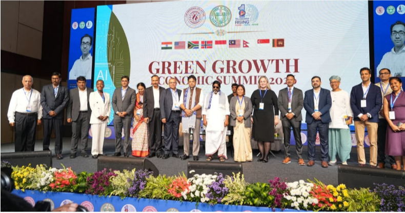
చర్యలు తీసుకుంటున్నామని చెప్పారు. పరిశ్రమలకు భూమి, నీరు, విద్యుత్ కేటాయిం చదం మాత్రమే కాకుండా స్థానిక యువతకు నైపుణ్య శిక్షణ, స్వచ్ఛ ఇంధన వినియోగం, పునరుత్పాదక ఇంధన వినియోగం తప్పనిసరి చేయాలని ప్రభుత్వం భావిస్తోందన్నారు. ప్రపంచం కార్బన్ క్రెడిట్ గురించి మాట్లాడుతున్న సమయంలో తెలంగాణ ప్రజల ప్రయోజనాలను కేంద్రంగా చేసుకున్న 'ప్రజల ప్రోత్సాహం' భావనను ముందుకు తీసుకొస్తోందిని వివరించారు. సాంకేతికత వ్యవసాయానికి, తాగునీటి అవసరాలకు పోటీగా మారకూడదని భట్టి విక్రమార్క స్పష్టం చేశారు. గ్రామీణ యువతకు ఉపాధి అవకాశాలు కల్పించేలా, భాషా అవరోధాలను తొలగించేలా కృత్రిమ మేధను అందుబాటులోకి తీసుకురావడమే ప్రభుత్వ లక్ష్యమని చెప్పారు. ముఖ్యమంత్రి రేవంత్ రెడ్డి