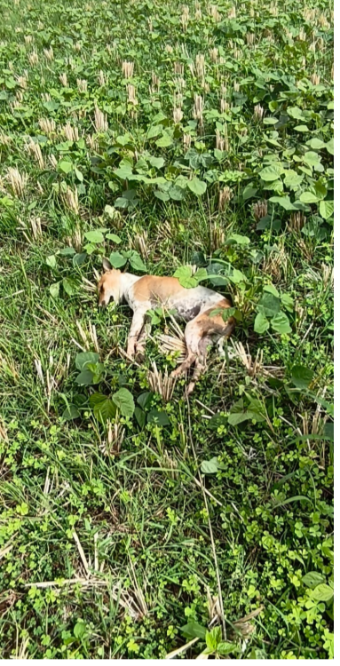
హారం మంజూరు చేసి బాధిత రైతు కుటుంబాన్ని ప్రభుత్వం తక్షణమే ఆదుకోవాలని గ్రామస్థులు, రైతులు విజ్ఞప్తి చేశారు.