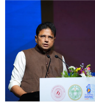
నాయకత్వంలో తెలంగాణ శాస్త్ర, సాంకేతిక రంగాల్లో వేగంగా ముందుకు సాగుతోందని ఉప ముఖ్యమంత్రి పేర్కొన్నారు. పెట్టుబడిదారులకు అనుకూల వాతావరణం, పారదర్శక పాలన, ప్రజాకేంద్రిత అభివృద్ధి విధానాలతో హైదరాబాద్ ను బాధ్యతాయుత కృత్రిమ మేధకు ప్రపంచ స్థాయి కేంద్రంగా తీర్చిదిద్దేందుకు ప్రభుత్వం కట్టబడి ఉందని ఆయన తెలిపారు.