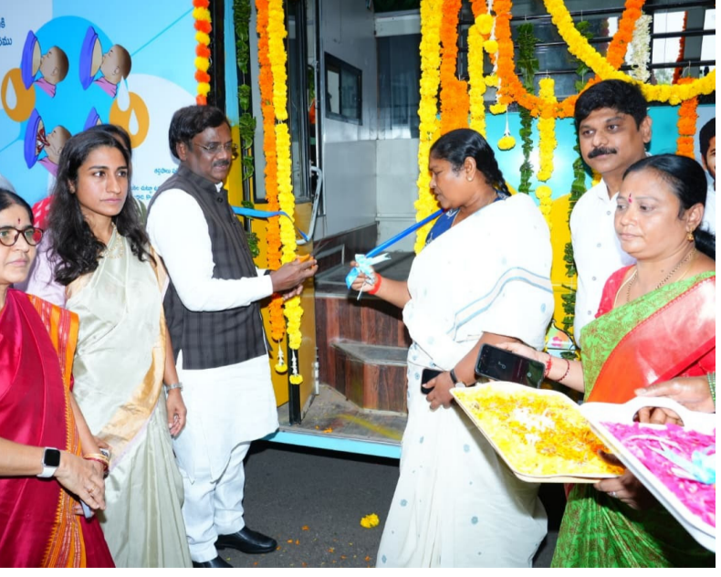
యని మంత్రి వివరించారు. హైదరాబాద్ వంటి నగరాలకు ఉపాధి కోసం వచ్చే కుటుంబాల చిన్నారులు అంగన్వాడి సేవలకు దూరం కాకుండా ప్రభుత్వం ప్రత్యేక చర్యలు చేపట్టించుకున్నా. మొబైల్ అంగన్వాడి కేంద్రాల్లో సాధారణ అంగన్వాడి కేంద్రాల్లో అందించే అన్ని సేవలు అందుబాటులో ఉంటాయని తెలిపారు. పో