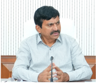
కోసం అవసరమైన స్థలాలను గుర్తించి పనులను వెంటనే ప్రారంభించాలని అధికారులను ఆదేశించారు. ఔటర్ రింగ్ రోడ్డు పరిధిలోని 39 సబ్ రిజిస్ట్రార్ కార్యాలయాలు 13 సమగ్ర కేంద్రాలుగా అభివృద్ధి చేస్తున్నామని మంత్రి తెలిపారు. ప్రభుత్వం ప్రైవేటు అధికార భారం లేకుండా ప్రైవేటు సంస్థల భాగస్వామ్యంతో ఈ భవనాలు నిర్మిస్తున్నామని, నిర్మాణంతో పాటు ఐదేళ్ల నిర్వహణ బాధ్యతను కూడా ఆయా సంస్థలే చేపడతాయని వెల్లడించారు. ఇప్పటికే నాలుగు ప్రాంతాల్లో నిర్మాణ పనులు ప్రారంభమై వేగంగా కొనసాగుతున్నాయని మంత్రి పొంగిలెట్టి తెలిపారు.

అలాగే స్థాంపులు, రిజిస్ట్రేషన్ల శాఖకు చెందిన 48 సబ్ రిజిస్ట్రార్ కార్యాలయాలు, ఆదిలాబాద్, ఖమ్మం, మహబూబ్ నగర్ జిల్లాల్లో జిల్లా రిజిస్ట్రార్ కార్యాలయాలు, నిజామాబాద్, వరంగల్ జిల్లాల్లో ఉప మహా తనఖీ అధికారి కార్యాలయాల నిర్మాణానికి రూ.97 కోట్లు మంజూరు చేసినట్లు వెల్లడించారు. మొత్తం రూ.360 కోట్లతో ఈ నిర్మాణాలకు పరిపాలనా అనుమతులు జారీ చేసినట్లు మంత్రి తెలిపారు. అన్ని భవనాలను ఒకే సమానాలో ఆధునిక సౌకర్యాలతో నిర్మించి ప్రజలకు వేగవంతమైన, పారదర్శక సేవలు అందించేలా రూపకల్పన చేస్తున్నామని చెప్పారు. నిర్మాణ బాధ్యతలను తెలంగాణ గృహనిర్మాణ సంస్థకు అప్పగించినట్లు పేర్కొన్నారు. అర్థి భవనాల్లో ప్రభుత్వ కార్యాలయాలు కొనసాగడం వల్ల ప్రజలు ఇబ్బందులు ఎదుర్కొంటున్నారని, అసమస్యకు శాశ్వత పరిష్కారం చూపేందుకే ఈ చర్యలు చేపట్టినట్లు మంత్రి వివరించారు. జిల్లా స్థాయిలో రెవెన్యూ అధికారులతో సమన్వయం చేసుకుని భవనాల