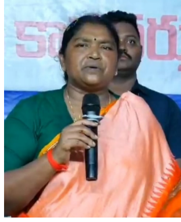
యాలని సూచించారు. గ్రామసభలకు ప్రాధాన్యత ఇస్తూ ప్రజల అవసరాలకు అనుగుణంగా వార్షిక కార్యచరణ ప్రణాళికలను

గురువారం ములుగులోని లీలా గార్డెన్‌లో నిర్వహించిన గ్రామ పంచాయతీ సమగ్ర అభివృద్ధి ప్రణాళిక, సర్పంచల శిక్షణ కార్యక్రమంలో ఆమె ముఖ్య అతిథిగా పాల్గొన్నారు. ఈ సందర్భంగా మంత్రి మాట్లాడుతూ ఇటీవల ఎన్నికైన సర్పంచలు, ఉప సర్పంచలు, గ్రామ పంచాయతీ కార్యదర్శులకు గ్రామ పాలన, పట్టణ, నిధుల వినియోగం, అభివృద్ధి ప్రణాళికల రూపకల్పన, ఆర్థిక నిర్వహణ, పారదర్శక పాలనపై పూర్తి అవగాహన కల్పించేందుకే ఈ శిక్షణ నిర్వహిస్తున్నామని తెలిపారు. గ్రామ పంచాయతీ ప్రజాప్రతినిధులు తమ అధికారాలు, బాధ్యతలు, ఆర్థిక నిబంధనలపై పూర్తి అవగాహనతో పనిచే