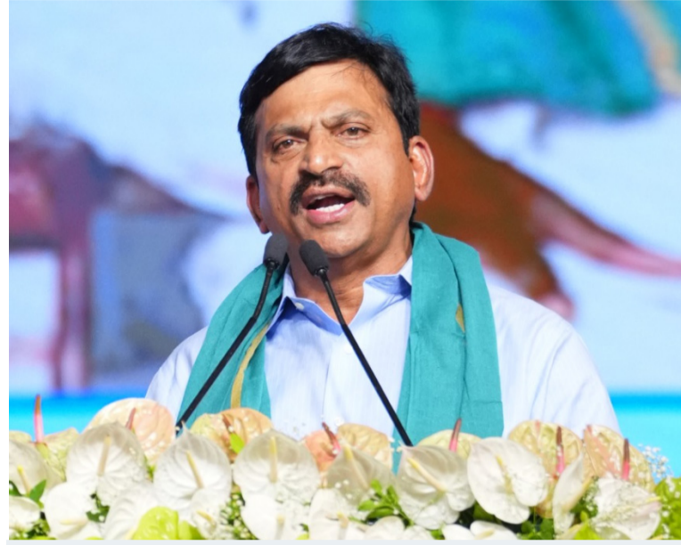
అవినీతి పిల్లలపై కాళేశ్వరం...!

ప్రస్తుత ప్రజా ప్రభుత్వం కేవలం మాటలకే పరిమితం కాలేదని, చేతల్లో చూపిస్తోందని మంత్రి అన్నారు. గత పాలకులు తాము చేసిన తప్పులను, అబద్ధాలను ఈ ప్రభుత్వం పై రుద్దాలని చూస్తున్నారని మండిపడ్డారు. 'ఎన్నికల ముందే చెప్పాం... కాళేశ్వరం ప్రాజెక్టులోని ప్రతి పిల్లలోనూ అవినీతి కొట్టొచ్చినట్లు కనిపిస్తోందని. ఇవాళ అదే నిజమైంది' అని విమర్శించారు. నీటిపారుదల శాఖపై ప్రతిపక్షాలు చేస్తున్న ఆరోపణలు హాస్యాస్పదంగా ఉన్నాయని, అబద్ధాల ప్రచారం మానుకోకపోతే ప్రజలు రాబోయే రోజుల్లోనూ తగిన బుద్ధి చెప్పడం ఖాయమని హెచ్చరించారు.